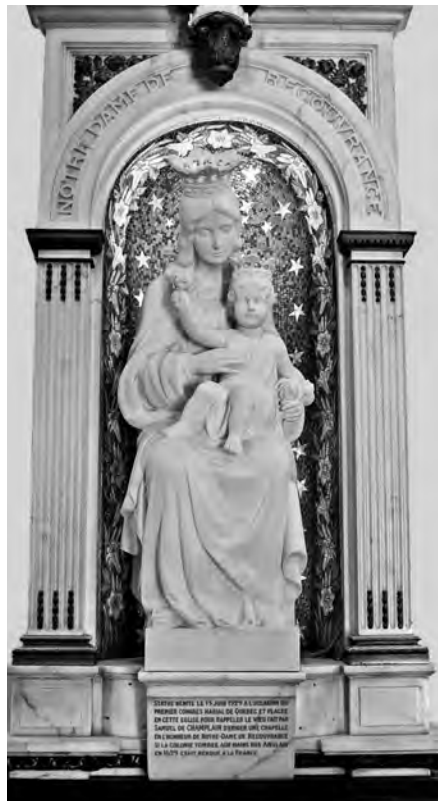
La statue de Notre-Dame-de-la-Recouvrance, à l'entrée de la nef de la basilique-cathédrale, rappelle l'église que fit construire Champlain, en 1633..

5 004 personnes. La cathédrale, vétuste, est devenue trop petite pour répondre aux besoins des offices dominicaux. À compter de 1745, Jacrau a donc à surveiller un important chantier de construction. La cathédrale, considérablement agrandie, prend les dimensions qu'on lui connaît aujourd'hui.