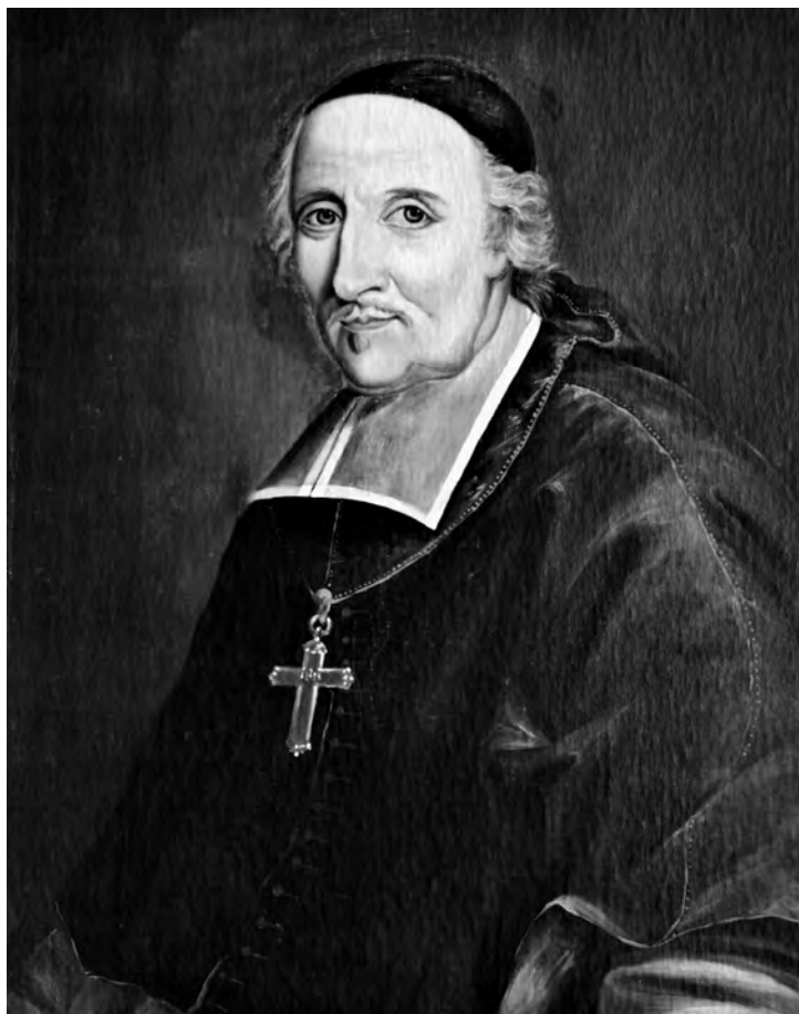
M gr François de Laval, devenu saint François de Laval le 13 avril 2014, l'année où sa paroisse, Notre-Dame de Québec, célèbre son 350 e anniversaire.

En son bien modeste Séminaire de Québec, le 15 septembre 1664, M gr François de Laval, évêque in partibus de Pétrée et « vicaire apostolique pour le royaume du Canada dans l'Amérique septentrionale », signe le décret d'érection de la paroisse de Québec sous le titre de l'Immaculée Conception de la Bienheureuse Vierge Marie. En dédiant la paroisse à Marie, M gr de Laval s'inscrit ainsi dans la continuité du fondateur de Québec, Samuel de Champlain, qui avait fait construire l'église Notre-Dame-de-la-Recouvrance, en 1633, et des Jésuites qui avaient inauguré l'église Notre-Dame-de-la-Paix, en 1650. Et c'est cette dernière église (sur le site de l'actuelle basilique-cathédrale Notre-Dame de Québec) qu'avait trouvée M gr de Laval à son arrivée à Québec, en 1659, et dans laquelle il célébrait depuis lors. Dans cette ville de Québec qui compte environ 70 mai-