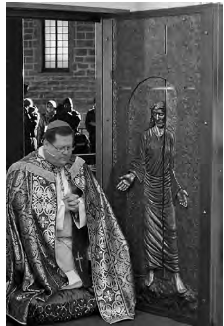
L'inauguration de la porte sainte par l'archevêque Gérald Cyprien Lacroix, le 8 décembre 2013. (Photo : Daniel Abel).

grande bourrasque de vent se lève. Surchargée, la chaloupe est submergée, précipitant tous ses passagers dans les eaux du fleuve. Hubert, emporté par le courant, se débat avec l'énergie du désespoir. Un dénommé Major parvient enfin à le toucher, mais il est incapable de le saisir. Devant ses yeux, l'infortuné curé sombre dans les eaux.