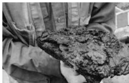
Restes calcinés de plusieurs volumes.

La découverte de quelque 35 fragments calcinés de livres constitue le fait saillant de la campagne de fouilles réalisée à l'été 2013 par la firme Ethnoscop sur le site du Marché-Sainte-Anne-et-du-Parlement-du-Canada-Uni dans le Vieux-Montréal. L'annonce de cette découverte a été faite le 1 er novembre dernier à l'occasion du lancement de la campagne majeure de financement de la Fondation Pointe-à-Callière pour soutenir le Musée et le projet de la Cité d'archéologie et d'histoire de Montréal. Très fragiles, les précieux artéfacts ont été vite envoyés à l'Institut canadien de conservation, à Ottawa, pour évaluer les possibilités de les restaurer à des