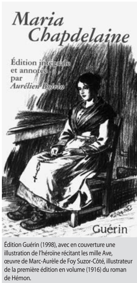
Édition Guérin (1998), avec en couverture une illustration de l'héroïne récitant les mille Ave, œuvre de Marc-Aurèle de Foy Suzor-Côté, illustrateur de la première édition en volume (1916) du roman de Hémon.

les sédentaires; les paysans venus de France, qui avaient continué sur le sol nouveau leur idéal d'ordre et de paix immobile, et ces autres paysans en qui le vaste pays sauvage avait réveillé un atavisme lointain de vagabondage et d'aventure » (OC, III, p. 256-257). Six mois à Péribonka ont suffi pour qu'il perçoive cette opposition.