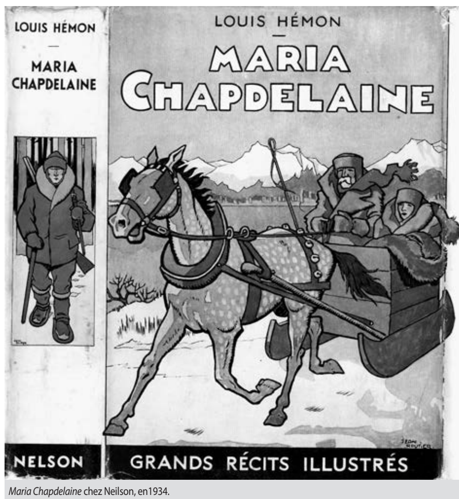
Maria Chapdelaine chez Neilson, en 1934.