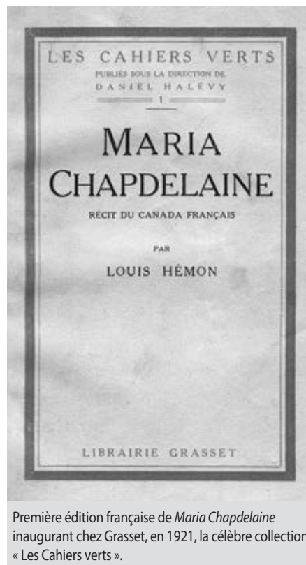
Première édition française de Maria Chapdelaine inaugurant chez Grasset, en 1921, la célèbre collection « Les Cahiers verts ».

Après son service militaire à Chartres, en 1902, il s'exile à Londres, peut-être à la suite d'une mésentente avec son père, où il occupe diverses fonctions dans l'import-export en raison de sa maîtrise de l'anglais. Il participe, fin 1903, à un concours organisé par le journal sportif parisien Le Vélo , qu'il remporte avec un texte, « La rivière », paru dans le journal le 1 er janvier 1904. Il y publiera par la suite une cinquantaine de récits et plus de 150 chroniques sportives, que j'ai réunis dans le tome II de ses Œuvres complètes , paru chez Guérin littérature, en 1993. C'est aussi à Londres qu'il écrit d'abord des nouvelles, dont l'une, « Lizzie Blackston », publiée en feuilleton dans Le Temps , du 3 au 8 mars 1908, nouvelle qui sera incorporée au recueil La belle que voilà... , paru chez Grasset, en 1923, puis trois romans écrits à Londres entre 1907 et 1911, et publiés après Maria Chapdelaine , soit Colin-Maillard , en 1924, Battling Malone, pugiliste , en 1925, et Monsieur Ripois et la Némésis , en 1950 seulement. Le premier de ces romans raconte la longue et lente recherche de liberté et de vérité du héros Mike O'Bradley,