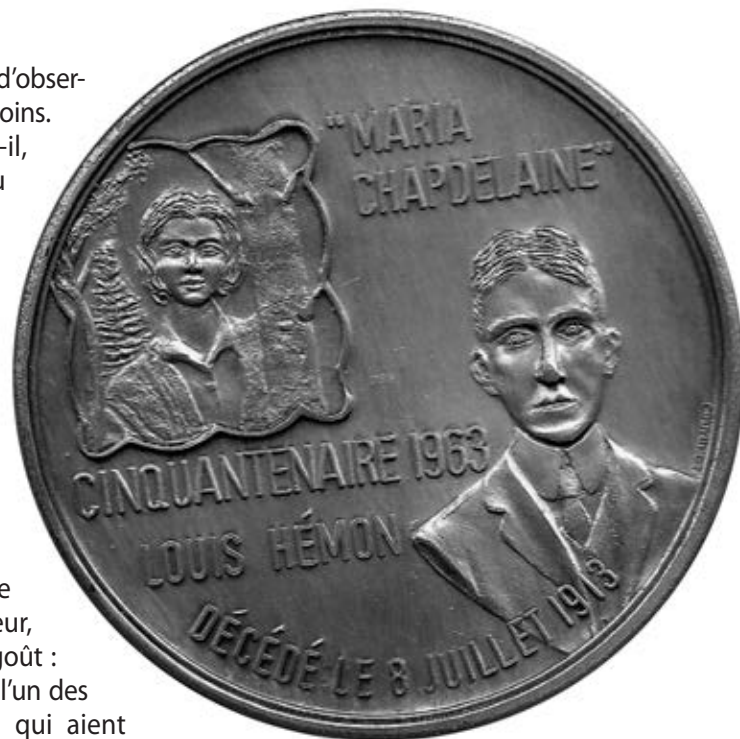
Médaille frappée par la compagnie Lombardo pour souligner le cinquantenaire du décès de Louis Hémon, en 1963. (Coll. privée).

Veillot répond longuement à cette critique, dans L'Action catholique , insistant sur le fait que, à son avis, l'œuvre traduit « ses propres visions canadiennes par l'hommage que [Hémon] rend à la fidélité de nos souvenirs. Il vous montre inévitablement attachés, poursuit-il, à la langue, aux principes, aux coutumes et jusqu'aux chansons de la vieille France ». Dans un deuxième article, il affirme que ce roman « porte un incontestable et heureux témoignage en faveur de l'esprit français ». Voilà, selon lui, une œuvre honnête, saine, « un récit probe et limpide qui, parce qu'il traduit bien l'âme canadienne peut servir à renforcer les relations entre les deux pays ». J'ajouterai encore qu'il est faux de prétendre que Hémon, ne sachant comment terminer son roman, selon certains, a inventé des voix pour inciter Maria à rester au pays, ainsi que le soutient Pierre Pagé. Les voix sont récurrentes dans l'œuvre de Hémon; elles apparaissent dans tous ses romans, même dans quelques-unes des nouvelles de La belle que voilà... Ce sont les voix de la conscience.