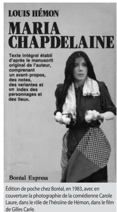
Édition de poche chez Boreál, en 1983, avec en couverture la photographie de la comédienne Carole Laure, dans le rôle de l'héroïne de Hémon, dans le film de Gilles Carle.

Contrairement aux romanciers québécois de la terre, Louis Hémon pose le problème de succession d'une tout autre manière. Il n'oppose pas les espaces, la campagne à la ville. Jamais il ne condamne Lorenzo Surprenant, qui a vendu la terre de son père pour aller gagner sa vie dans les manufactures de la Nouvelle-Angleterre, où il semble bien se tirer d'affaire. Il oppose plutôt – et il est le premier à le faire – les nomades et les sédentaires, ainsi que le confirme ce passage : « C'était l'éternel malentendu des deux races : les pionniers et