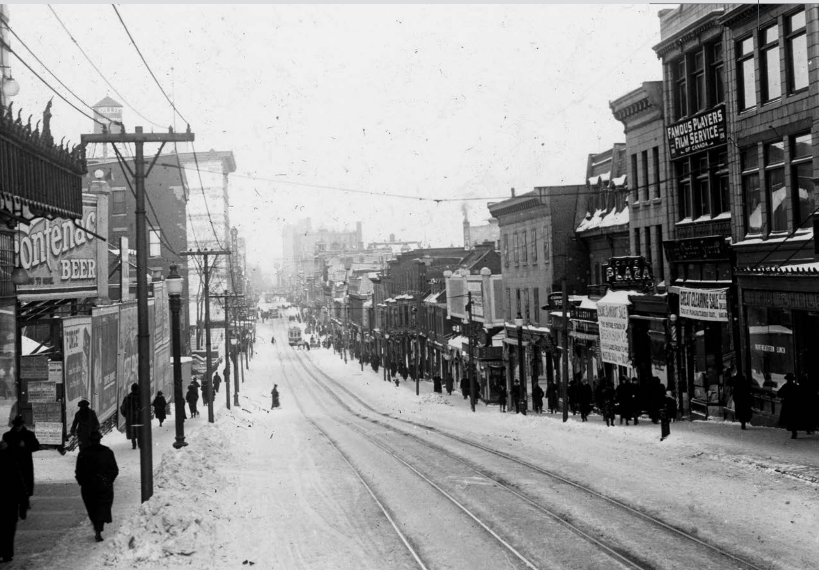
Rue Sainte-Catherine en direction est, à partir de la rue Balmoral, vers 1920.

des années 1920 ou Le pont Victoria , en 2002. L'année suivante, on assiste au lancement de l'exposition Horizons nouveaux : Nouvelle-France . Issue d'un partenariat entre Bibliothèque et Archives Canada, la Direction des archives de France, le ministère des Affaires étrangères du Canada de même que le ministère de la Culture et des Communications de France, le site est accompagné de la base de données Canada-France comprenant des milliers de pages de documents en lien avec le Régime français provenant de plusieurs institutions dont les Archives nationales du Québec et les Archives départementales françaises.