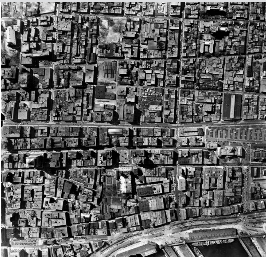
Vue aérienne du Vieux-Montréal et d'une partie du centre-ville, 1947. (Archives de la Ville de Montréal, VM97, S3, D7).

la rue Saint-Catherine. Dans ce dernier cas, la collaboration du public est également demandée pour en déterminer le lieu précis. Ce sont celles qui génèrent le plus de commentaires et qui circulent le plus sur la Toile.