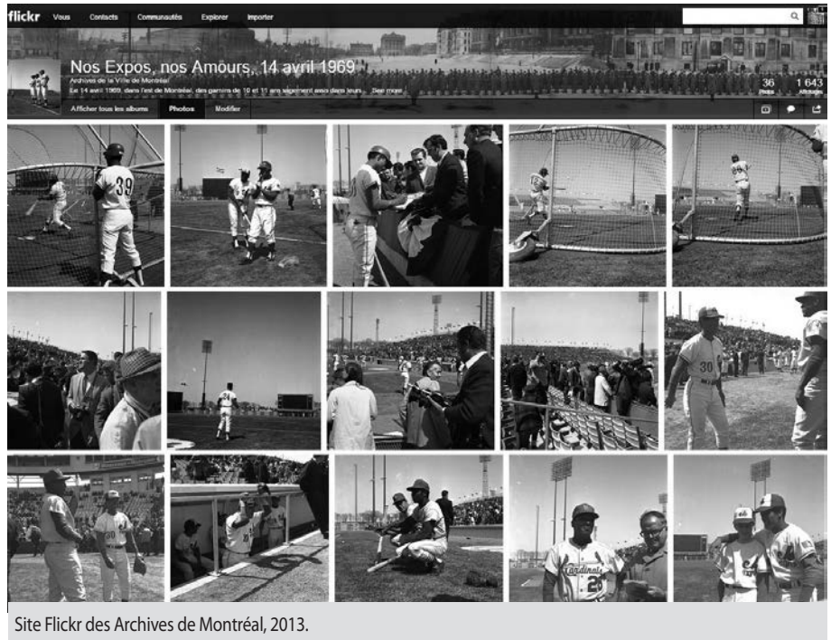
Site Flickr des Archives de Montréal, 2013.

Qui aurait cru qu'un jour on pourrait naviguer dans les photographies du Studio Notman, dans les manuscrits de Jacques Ferron ou dans les photos aériennes de Montréal en 1947? Qui aurait pensé que l'on pourrait revoir à sa guise le passage de Jack Kerouack à l'émission Le Sel de la semaine animée par Fernand Séguin, en mars 1967, ou consulter le contrat d'engagement de Louis Cyr comme policier dans la municipalité de Sainte-Cunégonde? Personne, y compris les archivistes. L'arrivée d'Internet a eu un impact majeur sur les centres d'archives et a modifié le travail des archivistes. Ces derniers avaient dorénavant la possibilité de présenter aux chercheurs et à un public élargi leurs précieux documents de tous types et de faire la promotion de leurs ressources historiques. Une nouvelle ère débutait.