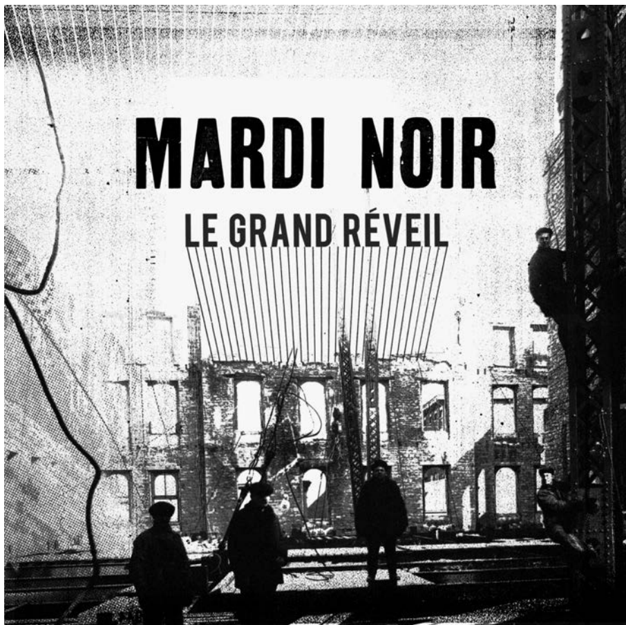
Pochette du disque Le grand réveil du groupe Mardi noir, paru en 2012.

Les Archives nationales du Québec ne sont pas en reste, car elles lancent, en juin 2005, le site Branché sur notre histoire qui contient 600 000 images numérisées, regroupées en thèmes, qui sont aussi intégrées à la nouvelle version de la base de données Pistard. L'année suivante, le Musée McCord dispose de plus de 70 000 photographies sur son site et le module Mon McCord (en 2007) permet aux usagers d'ajouter des mots-clés (ou tags) aux descriptions existantes et même de faire des montages d'images.