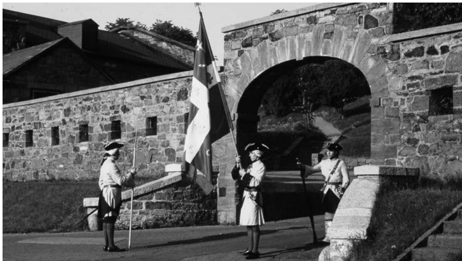
Pendant l'été 1966, le musée du fort de l'île Sainte-Hélène offre aux visiteurs une reconstitution historique des manœuvres militaires des soldats de la Compagnie franche de la marine.

privilegier les dispositifs interprétatifs textuels (expositions, panneaux, brochures) afin de cerner les connaissances historiques diffusées. L'histoire des personnages mis en scène, des formes d'animation privilégiées, des contenus de l'interprétation personnalisée, mais aussi celle des animateurs-interprètes eux-mêmes sont laissées pour compte. Ainsi, paradoxalement, l'élément clé de l'histoire vivante en contexte patrimonial échappe à l'observation. Mobilisée depuis plus d'un demi-siècle pour promouvoir la connaissance historique et la mise en valeur du patrimoine, l'histoire vivante n'est-elle pas aussi un patrimoine intangible, un patrimoine de la performance qu'il faudrait étudier et documenter? ■