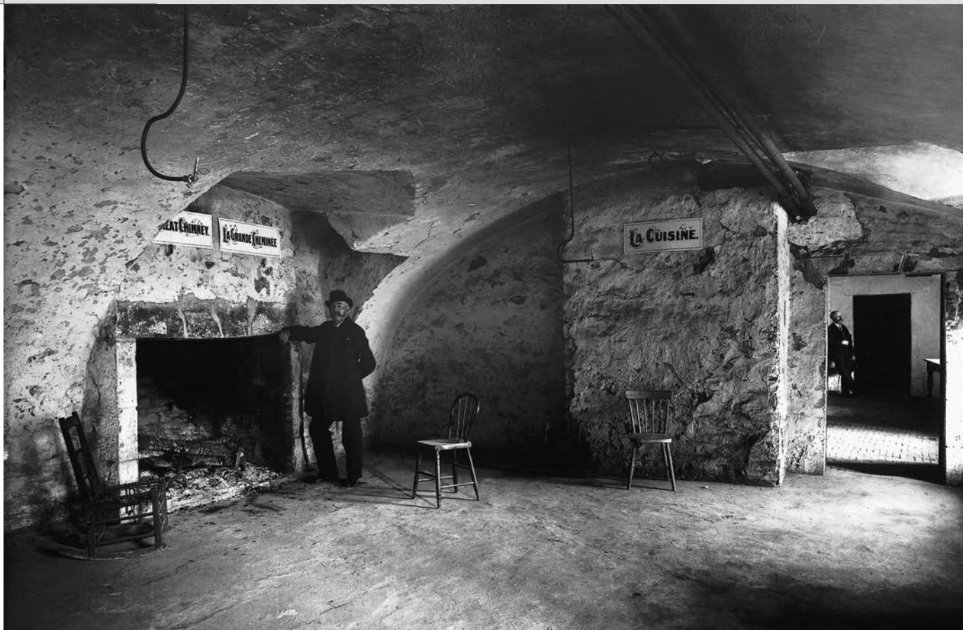
La cuisine du Château Ramezay, vers 1890. Un exemple précoce de period room : peu de mobilier, mais des panneaux pour orienter le visiteur. Cuisine du Château Ramezay, Montréal, QC, vers 1890.