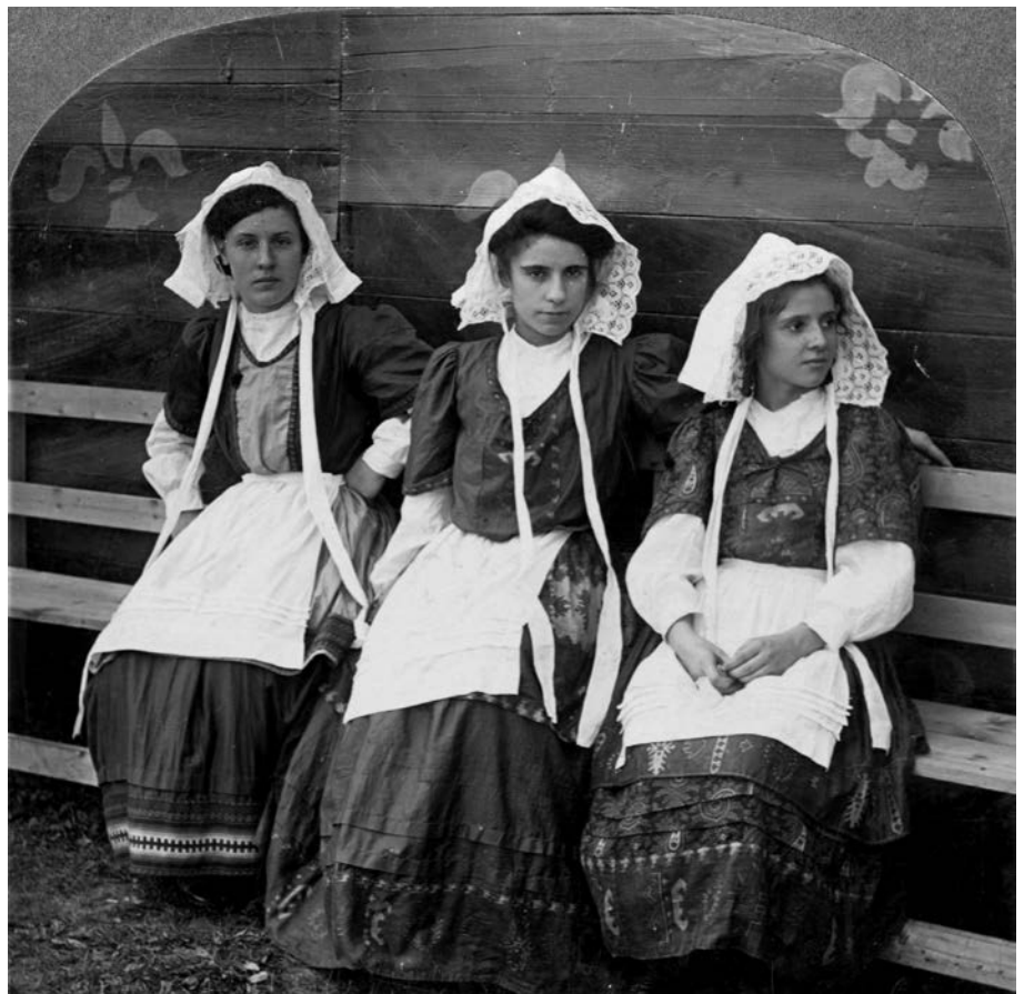
Ces jeunes paysannes de la Nouvelle-France participent à la reconstitution historique qui se déploie sur les plaines d'Abraham lors du tricentenaire de Québec, en 1908. Jeunes paysannes de la Nouvelle-France, 1620, 2 e reconstitution historique, tricentenaire de Québec, Québec, QC, 1908.

voire une année, qui sert à définir comment les lieux reconstruits ou restaurés devront ensuite être aménagés et meublés. Très souvent, le choix d'une année témoin condamne les personnages de la reconstitution et de l'animation à un présent éternel... Les pièces aménagées portent donc bien leur titre de period rooms . Si elles servent d'attribut essentiel du lieu reconstitué et animé, en revanche il ne s'agit pas d'une innovation récente dans l'univers muséal. Très tôt, des musées d'histoire et des musées d'art se dotent de period rooms , avec l'objectif de préserver un environnement résidentiel exceptionnel, quitte à le démonter et à le reconstruire ailleurs, ou encore afin de recréer un décor authentique dans un immeuble patrimonial. À la fin du XIX e siècle, la Société d'archéologie et de numismatique de Montréal, qui occupe le Château Ramezay, dote