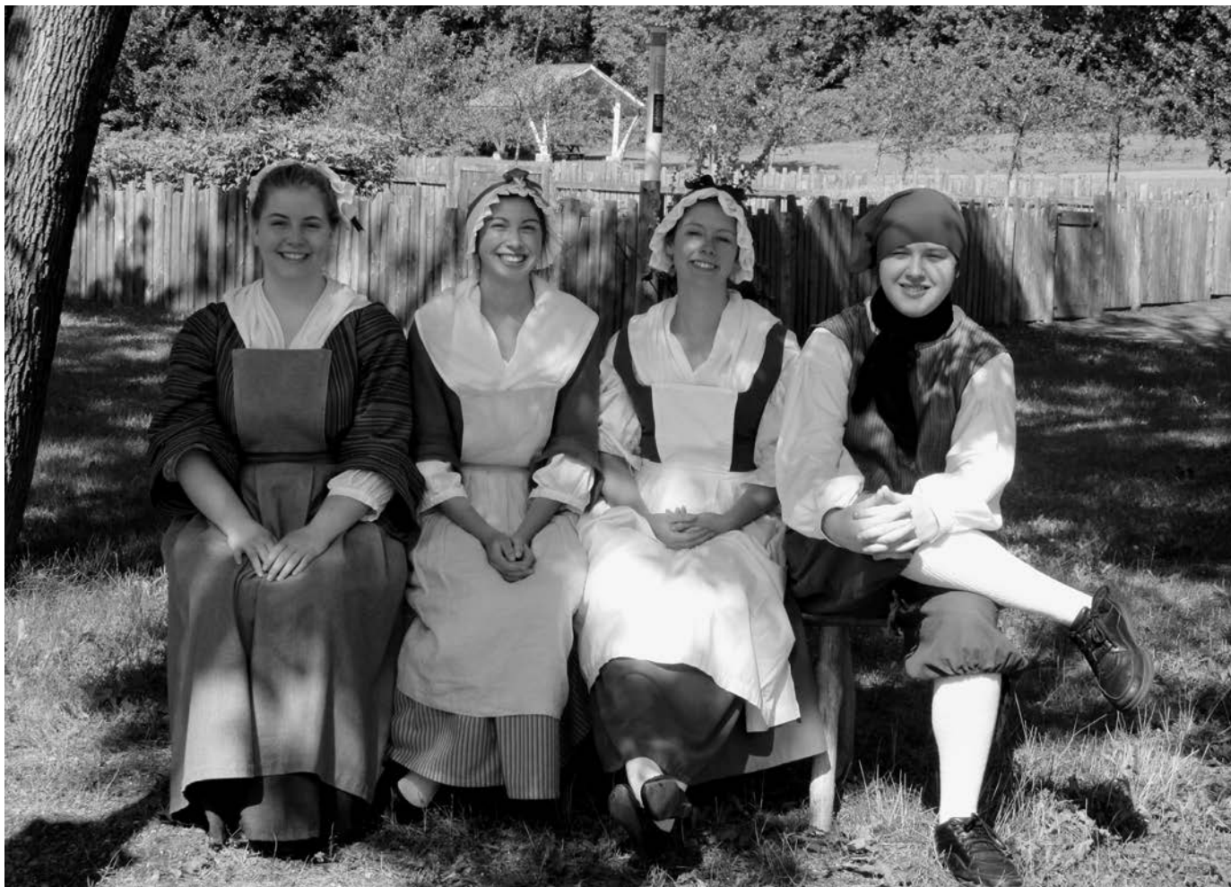
Au manoir Mauvide-Genest de l'île d'Orléans, des guides en costume d'époque font découvrir un manoir rural de la Nouvelle-France et son seigneur. (Manoir Mauvide-Genest).

Comment expliquer la rareté des études abordant l'interprétation personnalisée dans ces lieux chargés d'histoire? Les historiens s'intéressent certes au patrimoine, à la commémoration, à la construction de la mémoire publique. Leurs textes traitent de projets de restauration ou de reconstruction de sites historiques à des fins commémoratives, mais, dans la plupart des cas, l'accent est mis sur la dynamique de la patrimonialisation, sur les interventions et les intentions des principaux acteurs privés et publics. Le plus souvent consacrées à des expériences hors Québec, ces études insistent habituellement sur l'écart entre la réalité historique et le passé aseptisé ou idéalisé recréé pour