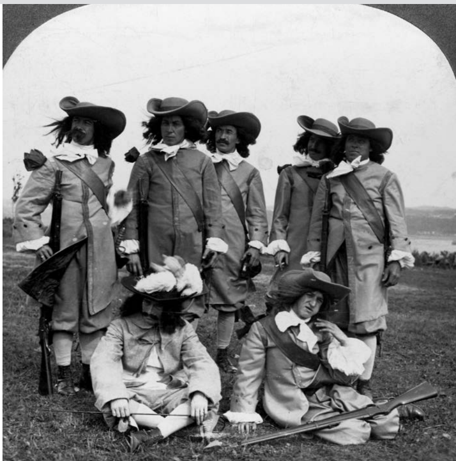
La reconstitution historique lors du tricentenaire de Québec, en 1908, réunit des centaines de figurants, dont ce groupe de soldats au service de Montcalm. Les soldats de Montcalm, reconstitution historique, tricentenaire de Québec, Québec, QC, 1908.

le public peuvent varier. On distingue habituellement entre l'interprétation personnalisée à la première et à la troisième personne. Comme le suggère la terminologie, dans le premier cas, l'interprète se voit confier un rôle précis et l'habite. Il est M. X ou M me Y., vivant à tel endroit, en telle année, avec telle fonction au sein de la maisonnée ou de la communauté. Dans les formes les plus achevées de reconstitution historique, notamment dans certains musées de plein air, l'interprète incarne pleinement son personnage et ses interactions avec le visiteur permettent à ce dernier d'appréhender non seulement le mode de vie, mais aussi la mentalité et la culture d'une autre époque. Dans la plupart des cas, l'animation n'est pas aussi immersive. Les objectifs poursuivis par la reconstitution historique sont plus modestes, les rôles assumés sont plus génériques – le visiteur rencontre une certaine domestique ou un certain forgeron, etc. L'interprétation pri-