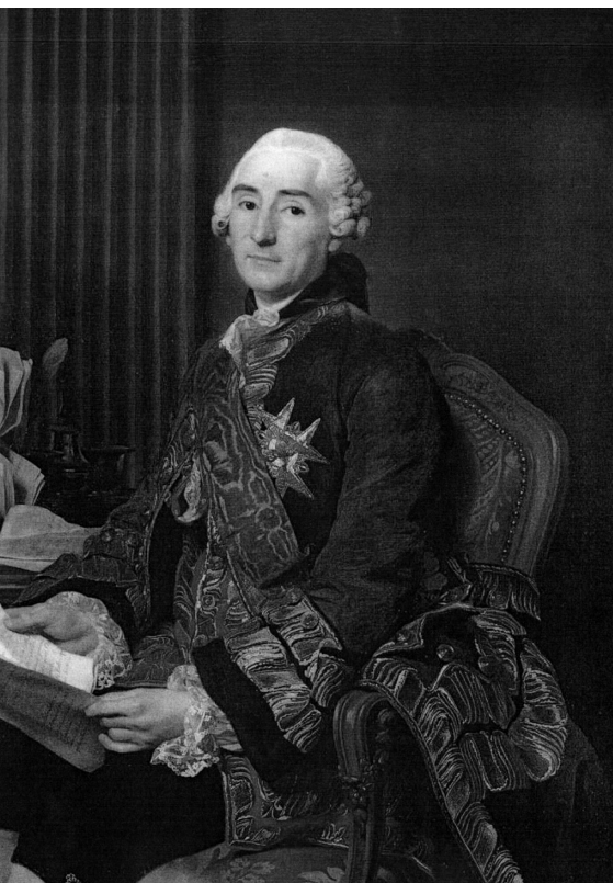
César-Gabriel, duc de Choiseul-Praslin (1712-1785), ministre français des Affaires étrangères de 1761 à 1766. Il signe le traité de Paris de 1763 au nom de la France.

Au terme de la campagne de 1758, les troupes françaises sont conscientes que l'armée britannique ne cesse de se renforcer grâce à sa flotte qui, tout en enserrant la Nouvelle-France, apporte renforts, munitions et vivres. À l'inverse, la disette croissante qui sévit dans la colonie a pour effet de miner la capacité des troupes et le moral de la population. Dès lors, plusieurs craignent pour Québec et le Canada. En octobre 1758, dans un mémoire, l'officier Louis-Antoine de Bougainville se questionne : « Si Québec est pris, le Canada est-il perdu? » et il ajoute : « La colonie peut-elle se soute-