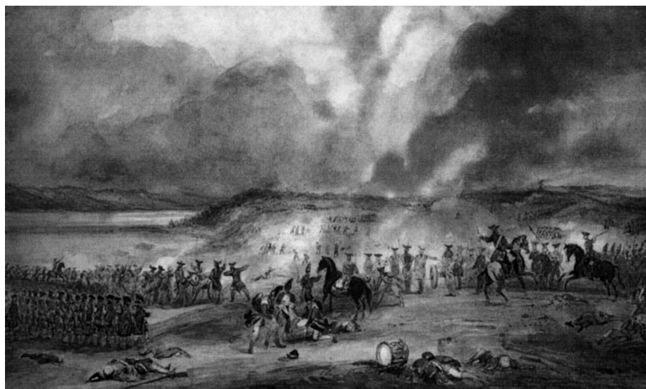
George B. Campion, Bataille de Sainte-Foy, 28 avril 1760 , aquarelle, vers 1850. (Commission des champs de bataille nationaux).

Dès le début des négociations, en 1761, la France pose comme principe