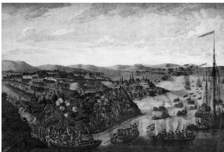
Hervey Smyth, La prise de Québec , gravure, 1797. (Collection privée).

En définitive, la cession de la Nouvelle-France s'inscrit dans une politique coloniale commerciale et non plus impériale. Que les troupes françaises aient réussi ou non à se maintenir dans une partie de la Nouvelle-France, comme le souhaitait Versailles à l'aube de la campagne de 1759, n'aurait rien changé aux négociations menant à la signature du traité de Paris. La bataille des plaines d'Abraham a marqué le début de la fin de la guerre de Sept Ans en Amérique en isolant la colonie et en rendant la paix incontournable. Ce sont toutefois les négociations du traité de Paris qui ont scellé le sort de la Nouvelle-France, dont le rendement économique en fit alors une négligée dans la hiérarchie des colonies. ■