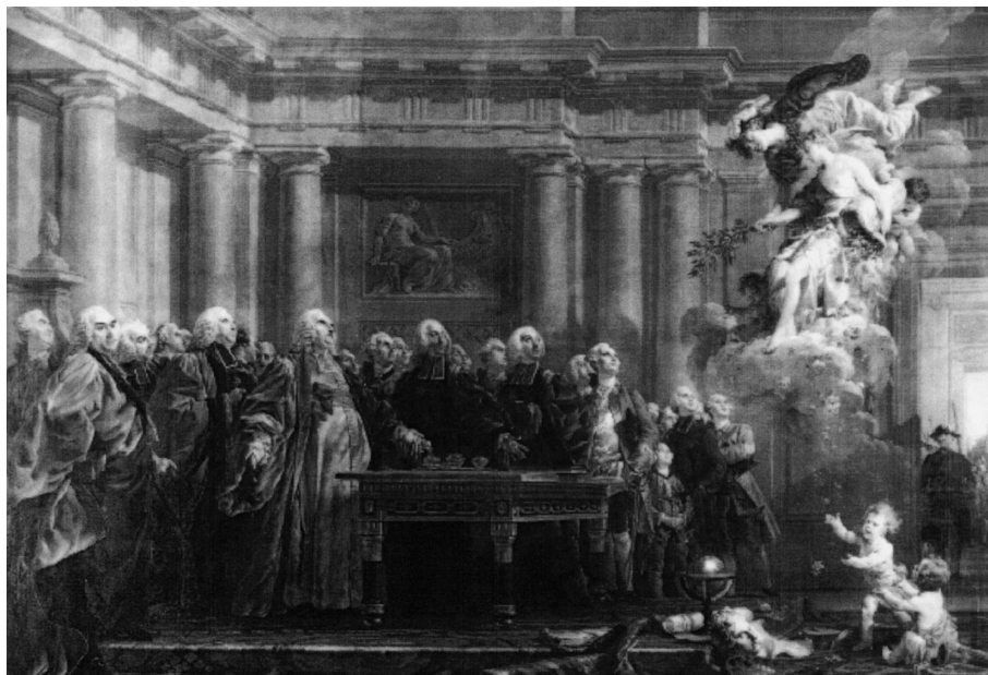
Noël Hallé Les magistrats de la ville de Paris recevant l'annonce de la paix, 21 juin 1763 , huile sur toile, 1767. (Châteaux de Versailles et Trianon).

Cette victoire obtient très peu d'écho en France, mais a pour effet de secouer les certitudes des autorités britanniques, comme en témoigne l'écrivain et politicien Horace Walpole : « Qui, diable, pensait à Québec? L'Amérique était comme un livre que nous avons lu et rangé sur nos rayons, mais voilà que nous nous reprenions à le parcourir en commençant par la fin. » Cette défaite