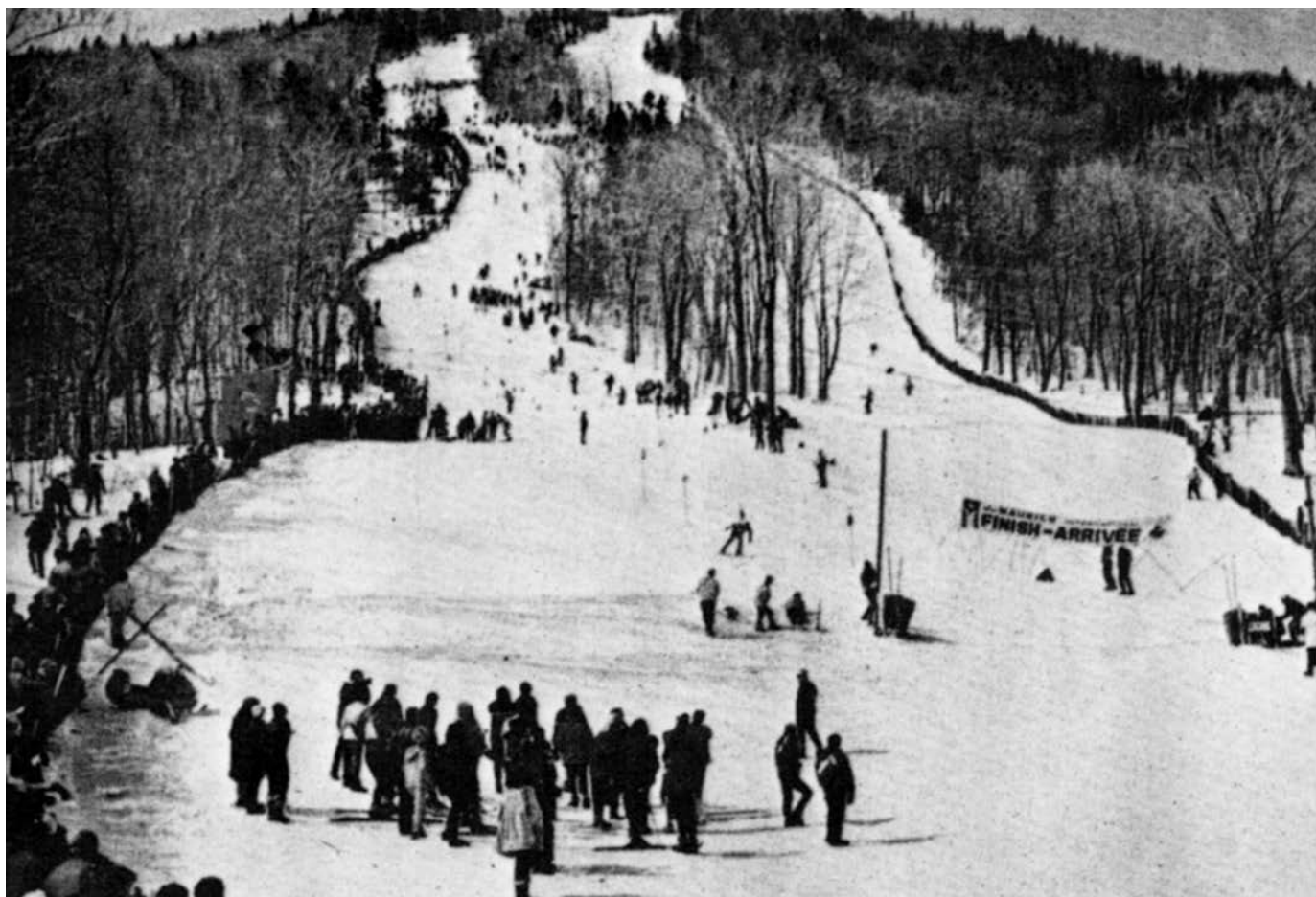
Image d'une des compétitions de la Coupe du monde de ski, à la fin des années 1960..

L'exposition permanente du Musée du ski de Québec, qui loge au mont Sainte-Anne.