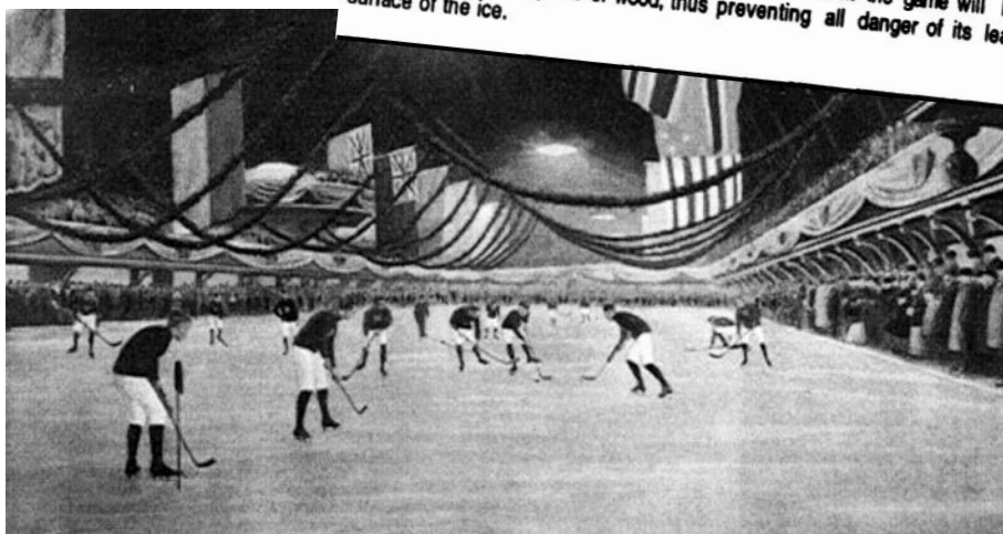
Texte : ( The Gazette , 3 mars 1875, p. 3). Victoria Skating Ring. Carte postale vers 1910.

Victoria Rink - A game of Hockey will be played at the Victoria Skating Rink this evening between two nines chosen from among the members. Good fun may be expected, as some of the players are reputed to be exceedingly expert at the game. Some fears have been expressed on the part of intending spectators that accidents were likely to occur through the ball flying about in too lively manner, to the imminent danger of lookers on, but we understand that the game will be played with a flat circular piece of wood, thus preventing all danger of its leaving the surface of the ice.