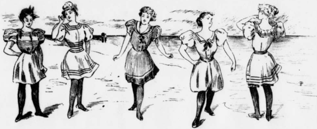
L'Église s'opposait à certaines pratiques sportives comme la natation ou la baignade, car elles obligeaient les femmes à se dénuder.

dans la seconde moitié du XIX e siècle et s'y greffent progressivement des tournois sportifs. En 1890, le pique-nique des cochers comprend 28 épreuves et une partie de baseball. D'autres types d'événements comme les fêtes champêtres, les anniversaires de municipalités ou de la reine Victoria incorporent des épreuves athlétiques et des sports d'équipe. Ces diverses fêtes auxquelles les clercs participent, soit directement comme organisateurs ou à titre d'invités, représentent des temps forts de la socialisation par le sport. Dans ces contextes, on peut dire que le « festif se vit aussi à l'enseigne de l'agonistique ».