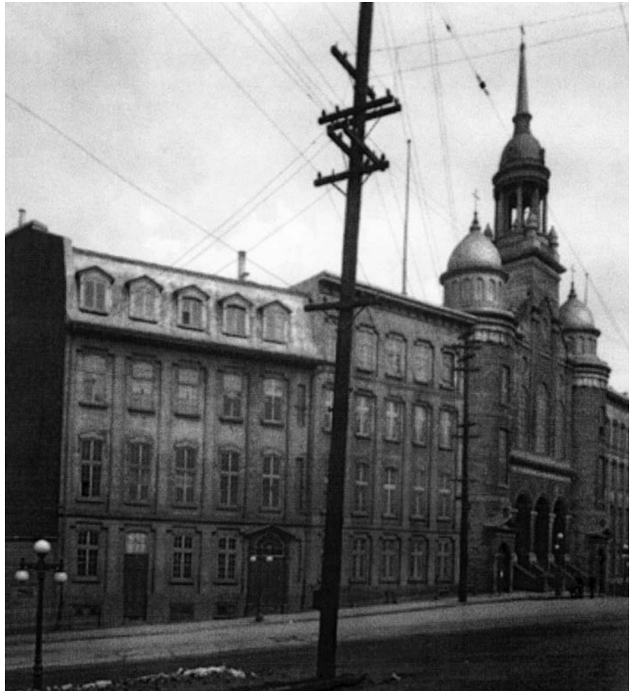
Le patro Saint-Vincent-de-Paul de Québec. Une œuvre qui intègre successivement les domaines de la charité, de la scolarité et des loisirs dont la gymnastique et les sports. Quartier Saint-Jean-Baptiste - côte d'Abraham - patronage et église Saint-Vincent-de-Paul (1937).

permettent guère l'éclosion de pratiques corporelles, mais la construction ultérieure de bâtiments plus vastes et le débordement de l'horaire scolaire vers les journées de congé et les longues vacances ouvrent une brèche, celle de l'occupation du temps libre, et entraînent la diversification de la clientèle. Ce temps libéré incite les religieux de Saint-Vincent-de-Paul à retenir des activités appréciées de leurs clientèles comme les jeux physiques. On les distingue toutefois des sports que le Directoire de la congrégation refuse d'introduire afin d'éviter tout esprit de rivalité entre les œuvres. On se tourne donc vers la gymnastique, introduite dès 1890, et certains jeux populaires. Tour à tour,