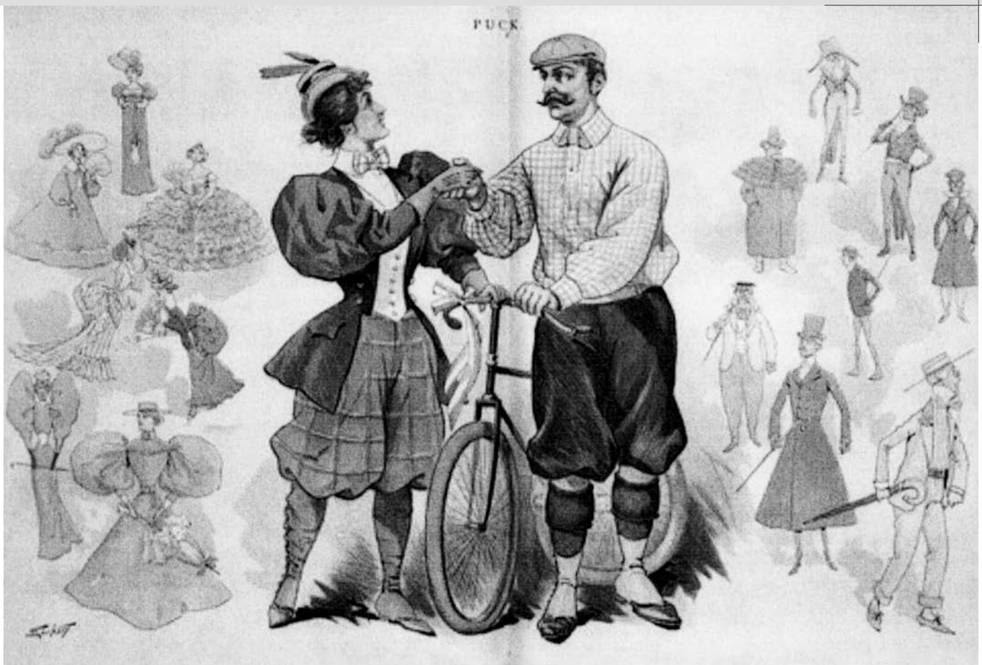
Pour pratiquer certains sports (cyclisme), dans des conditions optimales, des femmes en viennent à emprunter des vêtements réservés jusque-là aux hommes. Ce travestissement déplaît aux autorités religieuses de l'époque.

la transition qui s'est opérée chez certains clercs où l'approche traditionnelle du jeu, simple délassement peu conséquent, s'estompe au profit d'une perception plus raffinée de l'apport original et supplémentaire du sport : « Nous sommes même d'avis qu'il n'y a peut-être pas meilleure école pour la formation du caractère et l'exercice des vertus naturelles ». Ce type d'affirmation sera de plus en plus fréquent après la Deuxième Guerre mondiale.