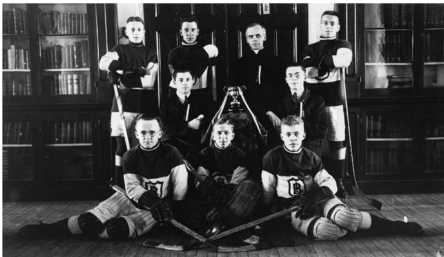
Au milieu du XIX e siècle, les collèges classiques constituent la première brèche par laquelle les sports pénètrent les œuvres cléricales. Il y en aura d'autres. Ici, le club de hockey au Séminaire de Québec, vers 1897.