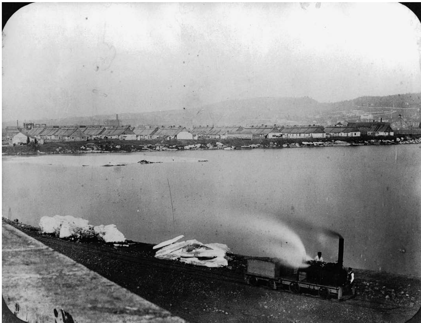
Sheds de Pointe-Saint-Charles depuis le haut du pont Victoria, Montréal, Qc, 1858-1859.

dais fuyaient la grande famine, qui touchait leur pays d'origine depuis 1845. Les mauvaises conditions de traversée dans les voiliers et le pou de corps, vecteur de la maladie, ont contribué à transporter une épidémie de typhus au Canada-Uni. Cette maladie, caracté-