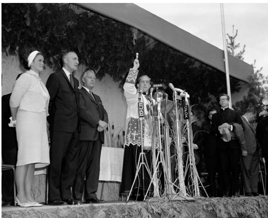
Autrefois, l'inauguration et la bénédiction allaient de pair, comme en fait foi cette photo prise lors de l'ouverture du pont de l'Île-aux-Tourtes, liant Vaudreuil-Dorion à Senneville, à l'extrémité est de l'autoroute Félix-Leclerc. Nous reconnaissons à gauche la ministre des Transports et des Communications, Claire Kirkland-Casgrain, le ministre de la Voirie, Bernard Pinard, et le premier ministre, Jean Lesage. (Inauguration du pont de l'Île-aux-Tourtes, Claude Gosselin. 1965. Bibliothèque et Archives nationales du Québec).

Pour identifier une autoroute, le ministère des Transports lui attribue un numéro selon la classification du réseau routier au Québec. Les adjectifs numériques constituent la seule désignation officielle pour une dizaine d'autoroutes du Québec. Ces dénominations par numéro sont des noms officiels, demeurent très pratiques dans la communication, et