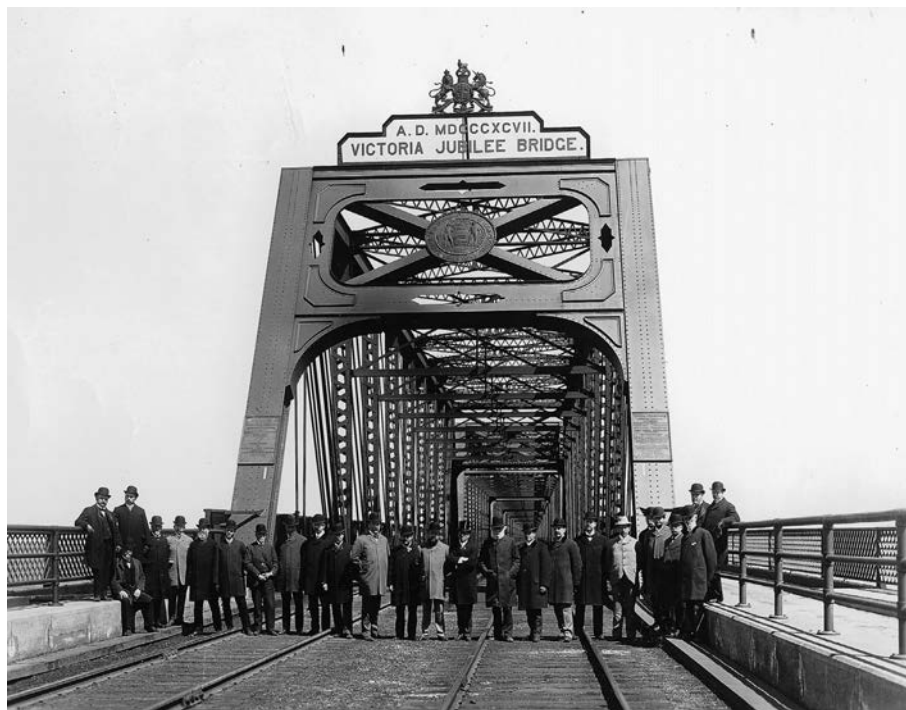
Lors de la réouverture du pont sous l'appellation Victoria Jubilee Bridge. (Pont Victoria, Montréal, QC, 1897. Wm. Notman & Son. Musée McCord).

L'appellation autoroute du Souvenir identifie une section de l'auto- route 20 de 68,4 km entre Rivière-Beaudette, à la frontière de l'Ontario, et l'échangeur Tur- cot à la jonction des autoroutes Décarie