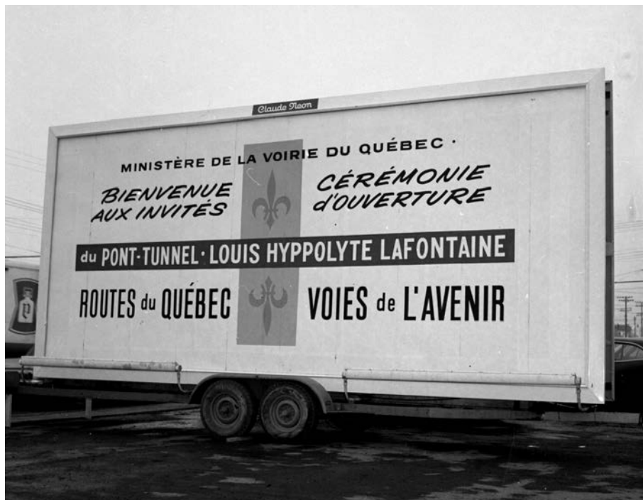
Cérémonie d'ouverture du pont-tunnel Louis-Hippolyte-La Fontaine. Adrien Hubert, 1967. (Bibliothèque et Archives nationales du Québec. E6S7SS1D670571).

La région de Montréal, pour sa part, compte aussi d'importantes infrastruc- tures dont la désignation rappelle le souvenir de personnages historiques. L'auto- route Ville-Marie porte le numé- ro 720 et s'étend sur près de 9 km, de l'échangeur Turcot jusqu'à la hauteur du pont Jacques-Cartier. Sa désignation