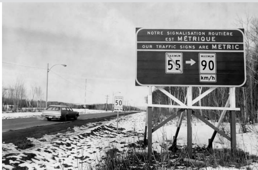
Panneau routier illustrant l'époque de la conversion au système métrique.

Dans un article substantiel intitulé « Le numérotage des routes » qui fait la page couverture du Bulletin en juin 1926, on présente ainsi un nouveau système : « Depuis le début de la saison, les automobilistes ont remarqué sur un certain nombre de routes une plaque blanche sur laquelle est dessiné le contour de la feuille d'érable reproduit sur cette page et encadrant un ou deux chiffres. C'est là la plus récente addition faite par le ministère de la Voirie aux signaux routiers jusqu'ici en usage ». Selon ce système, la route 1 reliait Montréal à Sherbrooke; la route 2 unissait Montréal à Québec par la rive nord; la route 3 partait de Lévis jusqu'à Saint-Lambert. La route 9 entre Longueuil et l'État de New York était surnommée la route Édouard VII (en l'honneur du roi