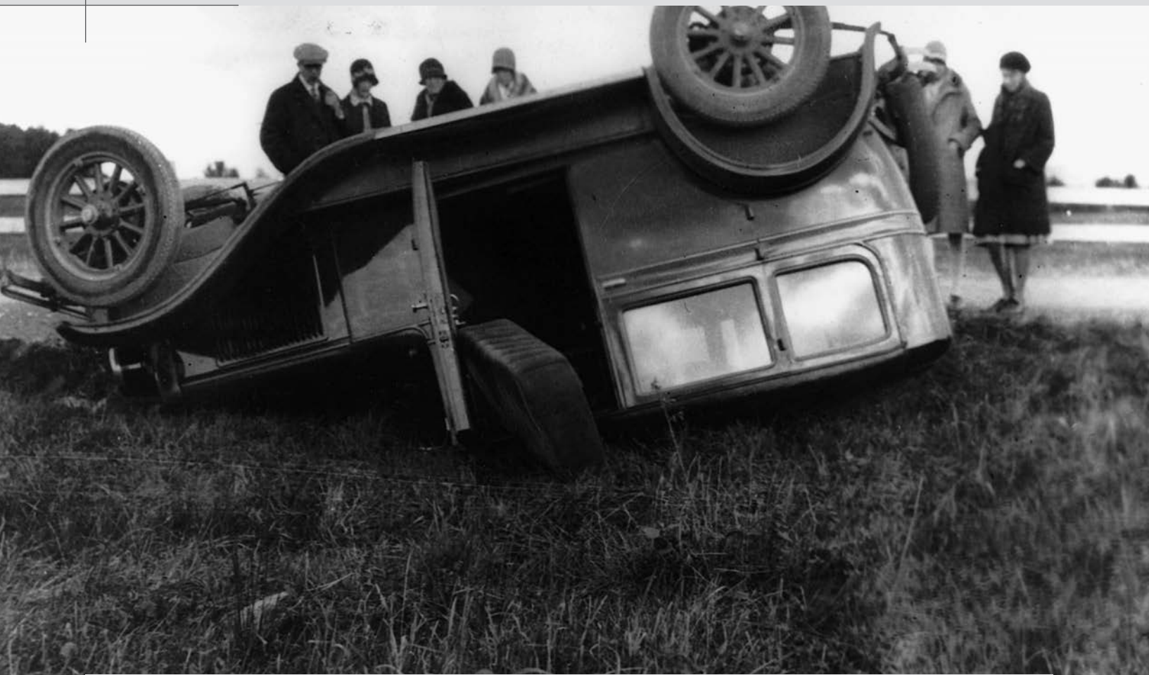
Automobile renversée, au sud de Montréal, QC, vers 1935.