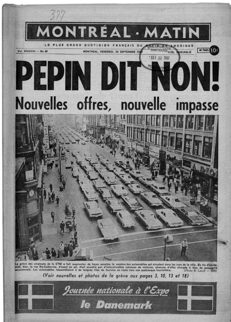
La une du Montréal-Matin , 22 septembre 1967. À cause de la grève des transports en commun, il y a beaucoup de circulation dans le centre-ville de Montréal.

Pour appuyer ses revendications salariales, le syndicat compare le salaire horaire des employés de la CTM à celui des employés de la Ville; le chauffeur d'autobus reçoit 2,77 $ l'heure, l'opérateur de balai à la Ville de Montréal, 3,32 $. On constate les mêmes disparités entre mécaniciens, machinistes et électriciens selon qu'ils travaillent à la Commission ou à la Ville, toujours en la faveur de cette dernière. On exige la parité avec les employés de la Ville de Montréal et avec ceux d'autres villes du Canada. Les patrons de la Commission rétorquent qu'il faudrait 24 millions de dollars de plus en revenus d'exploitation pour satisfaire ces exigences salariales, ce qui pourrait entraîner une substantielle augmentation des tarifs. Le lundi 18 septembre, on doit débattre en cour du renouvellement de l'injonction temporaire. Le syndicat ne prend pas ce processus judiciaire au sérieux et refuse