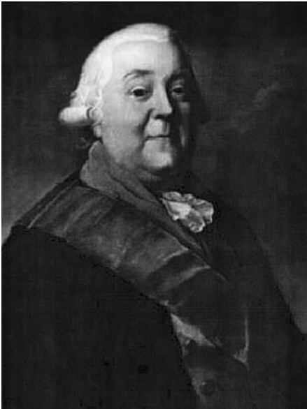
Le général baron Friedrich Adolf Riedesel. (Archives des auteurs).