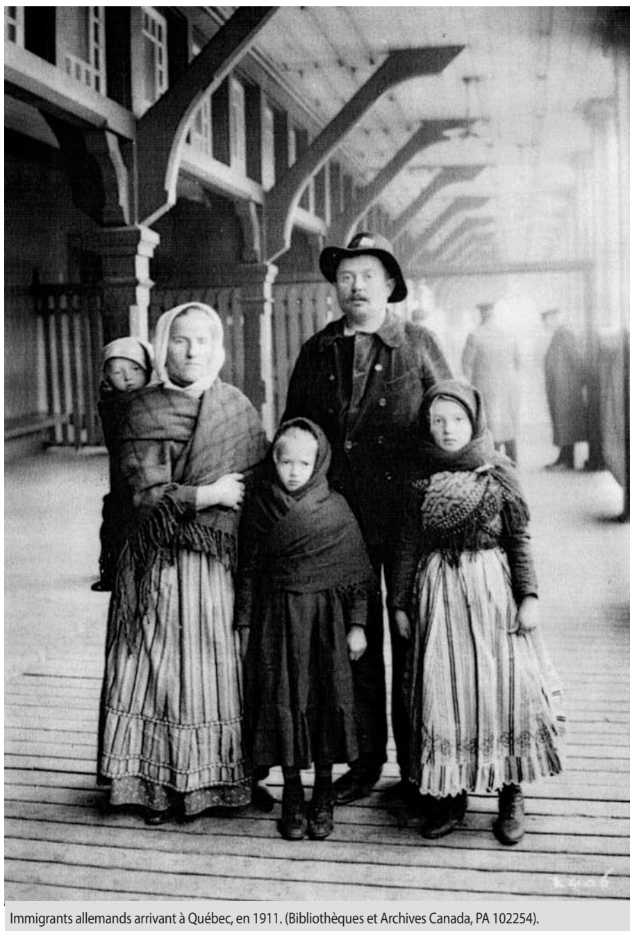
Immigrants allemands arrivant à Québec, en 1911. (Bibliothèques et Archives Canada, PA 102254).

codes culturels francophones apparaît calqué sur les réflexes historiques des Anglo-Québécois. Si certains répondants se sentent solidaires d'une affirmation nationale québécoise susceptible de réagir à l'oppression passée, peu souscrivent à l'idée d'indépendance du Québec. Venus d'une Allemagne amputée puis divisée après 1945, beaucoup ne souhaitent guère que les frontières de leur pays d'adoption soient elles aussi modifiées. Par ailleurs, le nationalisme