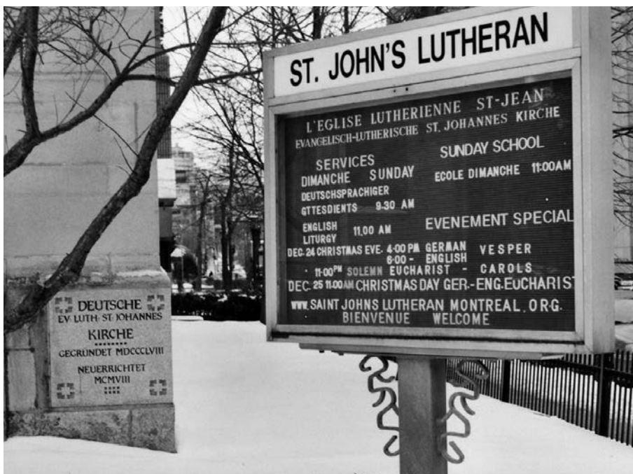
St. John's Lutheran Church (église luthérienne Saint-Jean) 3594, rue Jeanne-Mance, Montréal.

québécois suscite un certain malaise, même si la plupart conviennent qu'il ne ressemble pas à l'ultranationalisme dans l'Allemagne des années 1930.