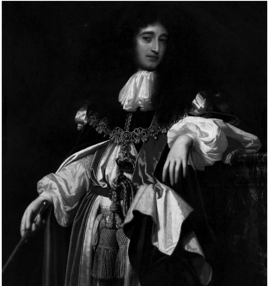
Simon Verelst (1644-1721). Portrait du prince Rupert du Rhin (1619-1682). Il fut le premier gouverneur de la Compagnie de la baie d'Hudson, en 1670. ( http://en.wikipedia.org/wiki/File:Prince_Rupert-Simon_Verelst.jpg )