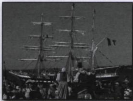
Arrivée du plus vieux trois-mâts français, le Belem , le 2 juillet 2008, dans le port de Québec.

La présence française au Québec est susceptible de s'accroître, à la suite de la signature par le président de