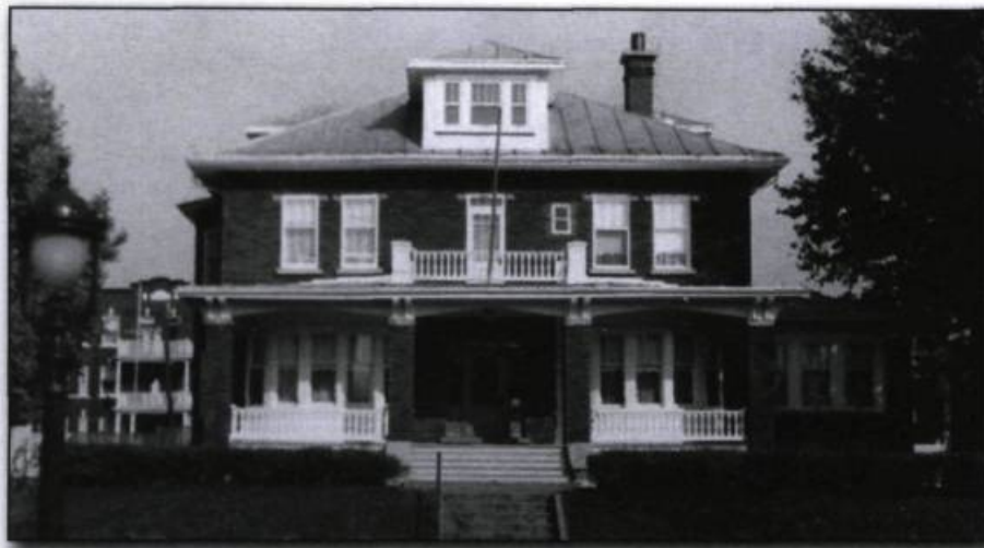
Résidence du consulat général de France, rue des Braves à Québec.

pressions budgétaires imposées de part et d'autre, la Commission permanente de coopération continue de soutenir les échanges entre les deux communautés, preuve de l'incontestable vitalité des relations franco-québécoises. En dépit de plusieurs tentatives de l'ambassade de France à Ottawa de rapatrier en son sein les pouvoirs du consulat 23 , le statut particulier de la représentation française a été préservé.