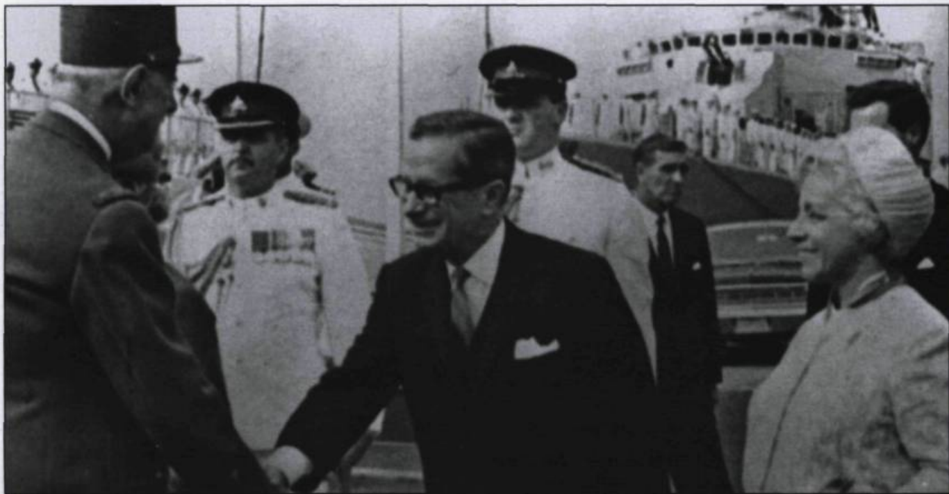
Voyage historique de Charles de Gaulle, président de la République française, au Québec, en 1967. Il est accueilli à Québec par le premier ministre Daniel Johnson et son épouse.

entente bilatérale franco-québécoise, qui est signée, à Paris, le 27 février 1965, par le ministre français de l'Éducation nationale, Christian Fouchet, et son homologue Gérin-Lajoie. Un deuxième accord, dans le domaine culturel, est paraphé le 24 novembre 1965, à Québec, par le ministre Pierre Laporte et l'ambassadeur de France, François Leduc.