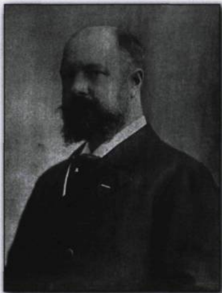
Alfred-Vinceslas Kleczkowski, consul général du 6 juin 1894 au 15 août 1906. ( Le monde illustré , vol 15, n° 772, p. 657, 18 février 1899).

Établis dans la vieille ville de Québec, les consuls abritent au sein de leur résidence la représentation française. Pour cette raison, le consulat connaît de fréquents déménagements. Lors de son arrivée à Québec, en 1875, le consul Albert Lefavre s'installe au 22, rue Couillard. Deux ans plus tard, il emménage dans des locaux situés au 10, rue des Carrières. En 1883, le comte Hervé de Sesmaisons s'installe au 54, rue Saint-Louis. Sous son successeur, Dubail, le consulat est trans-