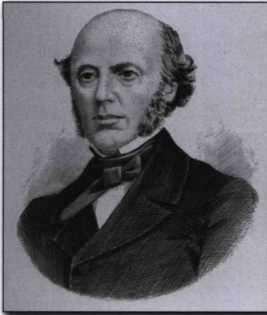
François-Xavier Garneau (1809-1866). Premier historien du Québec dont nous célébrons cette année le bicentenaire de la naissance. Illustration tirée de Benjamin Sulte, Histoire des Canadiens-français, 1882-1884.