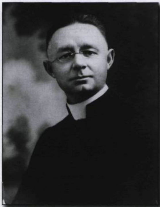
L'abbé Lionel Groulx (1878-1967), historien national. Carte postale sans date.

L'exode de Canadiens à la Conquête apparaît très complexe et diversifié. Certains sont partis par mobilité professionnelle. Au service du roi de France, des officiers de plume et d'épée sont passés en France avec épouses, enfants, beaux-parents, domestiques esclaves, etc. Ils ont quitté le Canada avec l'espoir que cette démonstration de leur loyauté et de leurs bons services serait vivement récompensé par un emploi intéressant en France. Des Canadiens de plus basse extraction sociale étaient également au service du roi et sont aussi partis avec leur famille pour les mêmes raisons : soldats mariés au Canada, sages-femmes « entretenues par le roi », pilotes et chirurgiens « du roi », employés spé-