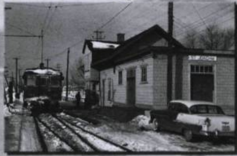
Cartes postales "Collection Art" Plus de 300 modèles disponibles