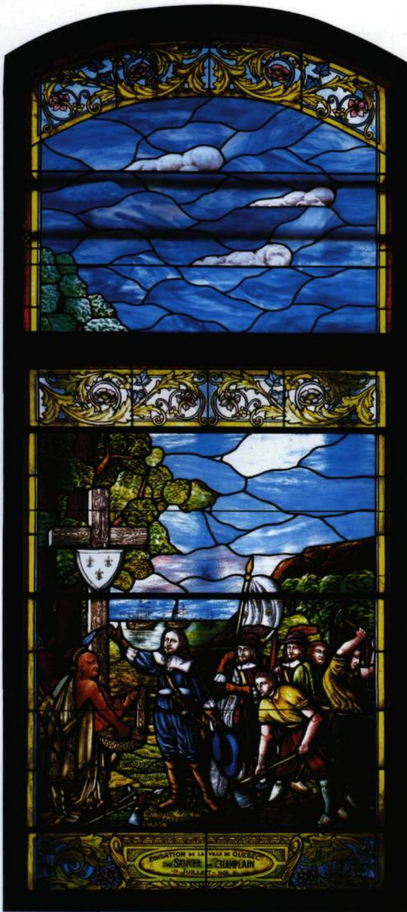
Champlain devant la croix à Québec (vitrail). (Archives de l'Assemblée nationale).

il porte aussi une signification religieuse, associée au choix et à la volonté divine. Le chêne représente la force et la durée, le laurier, la gloire et l'immortalité. Quant au papyrus qui orne les panneaux de bois des vestibules et des salles parlementaires, il est associé à l'écriture, au livre et à la pérennité du savoir et de la connaissance.