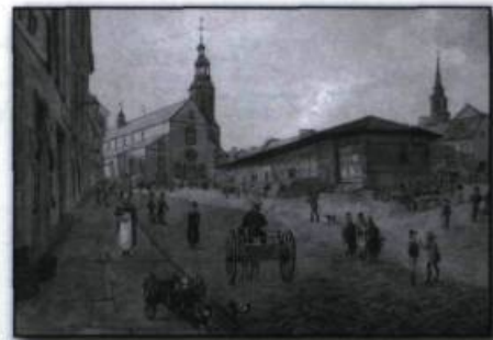
James Pattison Cockburn. La rue de la Fabrique et la cathédrale Notre-Dame de Québec , aquarelle et graphite sur papier, vers 1829. (Collection Peter Winkworth d'œuvres canadiennes, Bibliothèque et Archives Canada).

D'autres créateurs pratiqueront un art dans lequel on peut voir aujourd'hui une chronique de la vie quotidienne et un témoignage sur le développement urbain de la cité. C'est le cas des aquarelles, empreintes de calme et d'harmonie coloniale, du peintre topographe anglais James Pattison Cockburn qui propose diverses vues de la capitale entre 1829 et 1831, des tableaux apocalyptiques que Joseph Légaré consacre aux grandes tragédies – choléra, éboulis, incendies – qui ont bouleversé Québec pendant la première moitié du XIX e siècle, des représentations visuelles réalisées à la fin du XIX e siècle par Jules-Ernest Livernois qui utilise alors une nouvelle technique, la photographie, dont on ne sait pas encore si elle est un art.