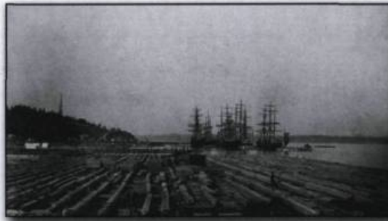
Les anses à bois de Sharple et Dobell à Sillery, en 1891.

La station des Cageux forme donc la nouvelle promenade Samuel-De Champlain, avec la station des Quais à l'est, la station des Sports et le boisé de Tequenonday, et contribue à rendre un hommage mérité au Saint-Laurent, principal acteur