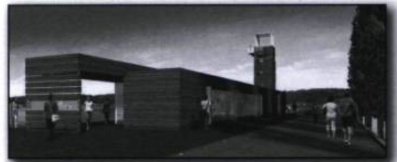
Illustration du pavillon d'accueil du quai des Cageux, à l'extrémité ouest de la promenade Samuel-De Champlain, dont les lignes rappellent des empilages de bois. Conception et design : Le consortium Daoust Lestage inc. Williams, Asselin, Ackaoui, Option Aménagement ©. (Commission de la capitale nationale du Québec).

Le long du Saint-Laurent, les madriers s'étendent à perte de vue de la fin avril jusqu'au gel. En hiver, plusieurs ouvriers travaillent comme bûcheron en Outaouais, coupant le bois avec lequel ils reviendront au printemps : ces ouvriers qui dirigent les radeaux sont appelés cageux ou raftmen . Majoritairement Canadiens français, ils