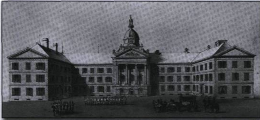
■ Premier parlement vu de l'avant. Litographie de Sarony et Major publiée à New York en 1852.

du Conseil souverain et seigneur de l'arrière-fief Monceaux de la seigneurie de Sillery, puis par l'intendant Jean Talon. C'est finalement en 1688 que M re Jean-Baptiste de La Croix de Saint-Vallier, deuxième évêque de Québec et successeur de M re François de Laval, acquiert le terrain. On y ajoute éventuellement le lot voisin occupé par le premier cimetière de la ville et on se départit de plusieurs autres parcelles, de sorte qu'en 1732, les limites actuelles du parc Montmorency sont fixées. En faisant l'acquisition de ce bien-fonds, M re de Saint-Vallier achète également la maison en pierre à deux étages qui s'y trouve. Celle-ci fait désormais office de premier palais épiscopal et de siège du diocèse de Québec. L'année suivante, l'évêque amorce la construction d'un mur de maçonnerie pour ceindre sa propriété. De 1693 à 1695, il y fait construire un nouveau palais en pierre de taille. Le projet est ambitieux et c'est uniquement l'aile sud-est du bâtiment qui est construite. Après sa mort, seuls M re Pierre-Herman Dosquet et M re Jean-Marie Dubreuil de Pontbriand habitent le nouveau palais.