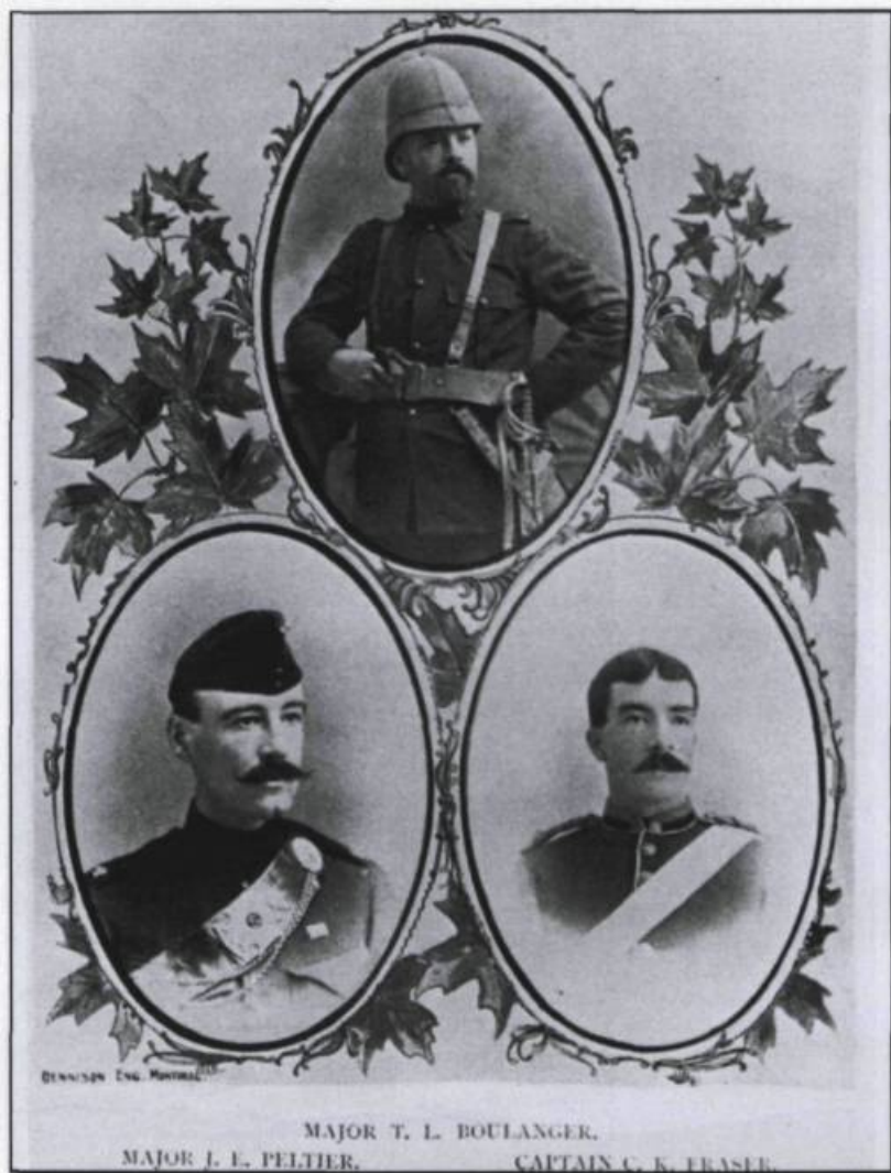
DENNISON ENG. MONTREAL

Le 30 octobre 1899, 1 500 volontaires canadiens (dont certains francophones) quittent le pays pour participer à la guerre des Boers, en Afrique du Sud. ( Le Mémorial du Québec , Tome IV, p. 871).