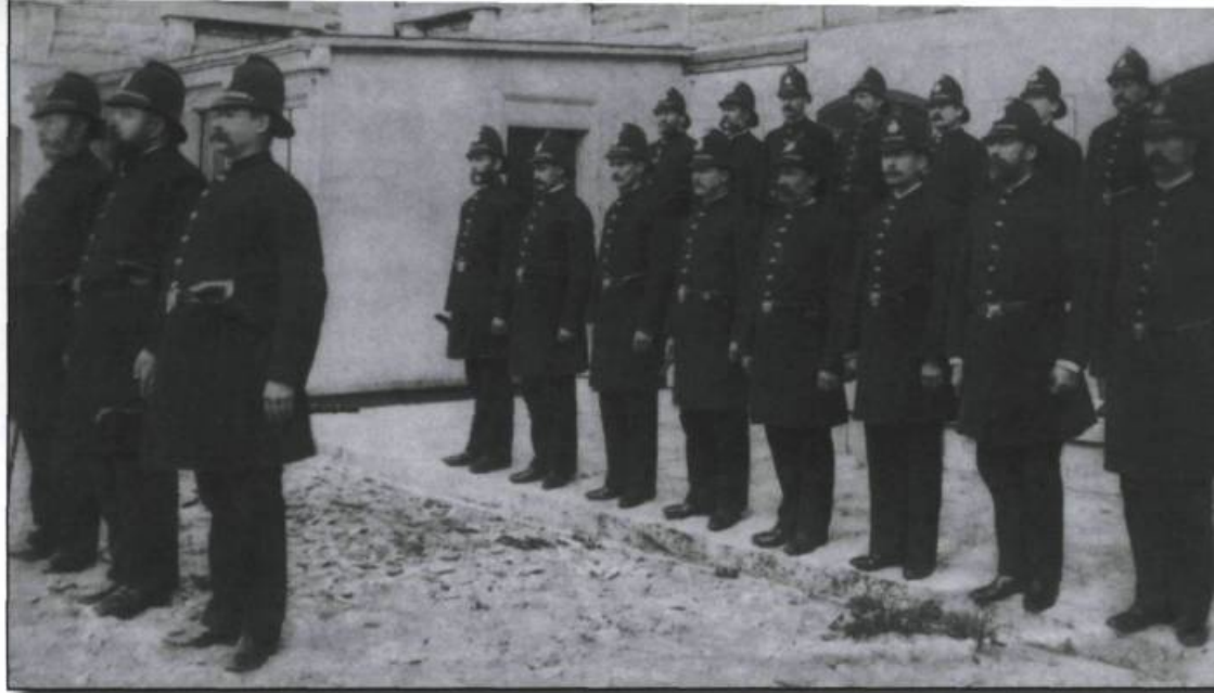
■ Policiers de la ville de Québec en 1894.