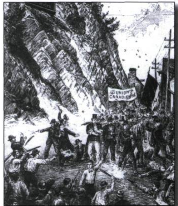
Scène d'affrontement entre des travailleurs d'origine irlandaise et des Canadiens français, rue Champlain à Québec, le 15 août 1879. ( L'Opinion publique , 3 septembre 1879).

En effet, quelles conséquences ce déséquilibre entraîne-t-il sur la qualité des rapports entre la police et les citoyens de Québec entre 1860 et 1900? Les Canadiens français acceptent-ils d'être « policés » par des anglophones, en particulier par des Irlandais? De même, les rapports de la communauté irlandaise avec la police de Québec s'en trouvent-ils facilités? L'examen des conflits entre policiers et citoyens survenus durant cette période nous permettra d'entrevoir une partie de la réponse.