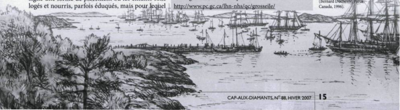
■ File d'attente des navires en quarantaine à la Grosse-Île. (Bernard Duchesne, Parcs Canada, 1996).

http://www.pc.gc.ca/lhn-nhs/qc/grosseile/