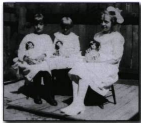
Au pays des enfants, redécouvrir dans une armoire vitrée, les poupées de jeux d'une époque révolue.

C'était le périlleux chemin des pionniers du Far West, la piste sinueuse des cowboys texans, les terres ancestrales des Sioux, lieu d'embuscades des Iroquois, de Radisson, Des Groseilliers, et des Apaches en peintures de guerre.