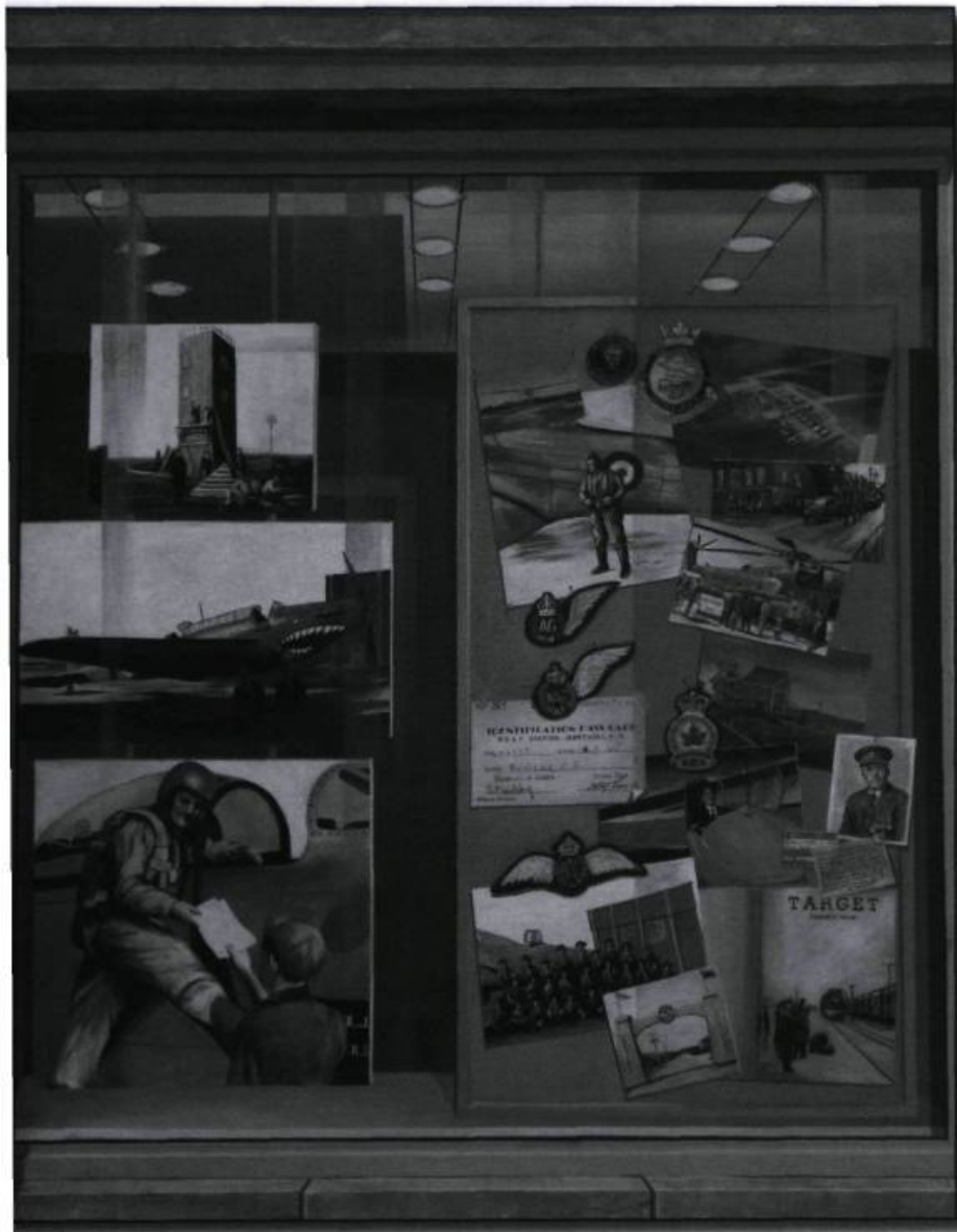
Murale dévoilée récemment pour rappeler la 9 e École de bombardement et de tir de Mont-Joli pendant la Seconde Guerre mondiale. (Photographie Rémi Sénéchal, 2006).

Pour les métiers plus militaires, comme bombardier et mitrailleur aérien, il fallait bien s'en remettre à l'expertise militaire. Comme les besoins en personnel cadre étaient importants, on avait tout avantage à créer de grandes écoles d'aviateurs afin d'optimiser les ressources. C'est pour cette raison que les écoles de bombardements et de tir étaient les plus grandes du programme.