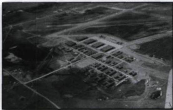
Cette vue aérienne (une des rares non officielles) montre bien toute l'étendue des installations. (Archives de l'aéroport de Mont-Joli).