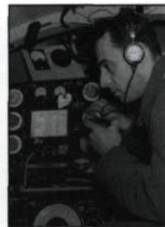
Garder en tout temps le contact avec le sol.

Mont-Joli, Bagotville et Saint-Hubert étaient des bases reconnues de l'Aviation royale du Canada. Construites sur un modèle similaire (mais de taille différentes), elles répondaient à des besoins standardisés pour un établissement dédié à l'aviation militaire. Mais les écoles d'aviateurs militaires du Québec n'étaient pas toutes des bases militaires. La 8 e École d'observateurs aériens, située à L'Ancienne-Lorette, partageait ses facilités avec l'aérodrome civil. En fait, l'école était opérée par des civils sous l'autorité du Commandement aérien N° 3 (de l'Aviation royale du Canada). Les activités de vol étaient supervisées par la Quebec Airways, une composante de la Canadian Pacific Air Lines. C'est également Quebec Airways qui dirigeait la formation offerte à l'école de Cap-de-la-Madeleine. Enfin, la 3 e École préparatoire d'aviation de Victoriaville s'installa, non pas sur un aérodrome militaire, mais plutôt dans un établissement d'enseignement civil, le Collège du Sacré-Cœur.