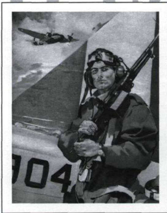
Mitrailleur aérien devant son appareil d'entraînement, en 1942.

Le Québec eut une part modeste des installations du PEACB. En plus de la très imposante 9 e École de bombardement et de tir de Mont-Joli, le PEACB installa une école d'observateurs aériens à l'aérodrome de L'Ancienne-Lorette, une école préparatoire d'aviation à Victoriaville, des écoles élémentaires de pilotage à Windsor Mills, Pendelton, Saint-Eugène, une école de pilotage militaire à Saint-Hubert et en-