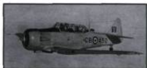
Le plus connu des appareils de PEACB, le Harward. (Archives de l'aéroport de Mont-Joli).

Sous-traiter avec des organismes civils pour la formation des pilotes était une nécessité incontournable. En effet, les délais requis pour mettre en marche toutes les écoles du PEACB empêchaient une progression normale des effectifs. Pas le temps d'engager des instructeurs pilotes et de les faire progresser, même en accéléré, dans le système militaire. Il valait mieux engager des compagnies de transports, même des écoles privées de pilotage (comme à Victoriaville) et les mandater pour la formation du personnel. Évidemment, seuls les métiers « civils » de l'aviation, comme la navigation et le pilotage, permettaient cette approche.