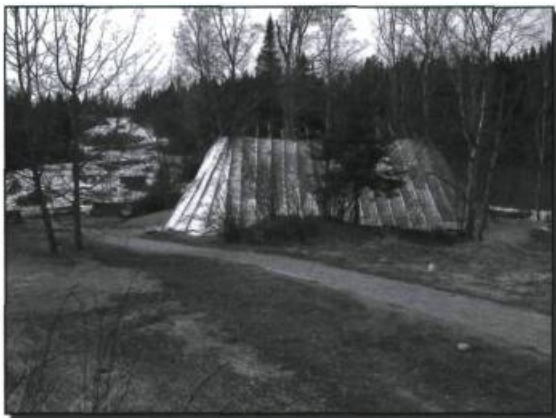
Papinachois, site patrimonial et touristique, où sont reconstitués divers types d'habitation démontrant l'évolution historique des matériaux et des techniques de construction. Communauté de Betsiamites. (Photo Élise Dubuc, 2005).

De façon plus personnelle, les objets conservés dans les familles demeurent les témoins d'une culture vivante. Les photographies préservées dans les albums ou exposées sur les