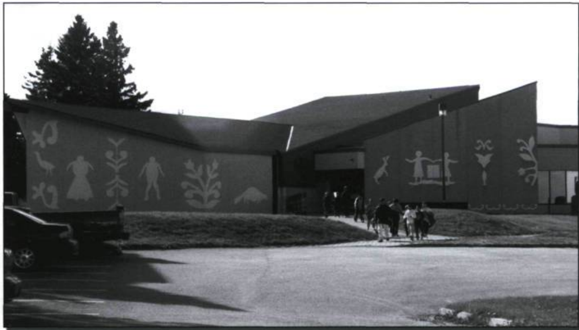
Musée amérindien de Mashteuiatsh. (Photo France Tardif, 2006).

Aujourd'hui, les Innus utilisent des moyens de communication, support de la parole tant valorisée par la tradition orale, et qui servent également à diffuser les créations des nombreux groupes de musique, activité populaire parmi les jeunes. La radio communautaire est omniprésente dans les villages où elle est écoutée, tant à la maison que dans les voitures. Les C.B. assurent les communications entre les campements. Les plus fortunés accèdent à la forêt avec des moyens de toutes sortes : motoneiges, VTT, véhicules utilitaires sport, embarcations motorisées. Les objets de la vie traditionnelle qui ne sont plus indispensables prennent cependant un relief particulier. Plusieurs sont devenus des symboles identitaires. En s'éloignant du panaméricanisme du début du XX e siècle et des grandes coiffes à plumes des nations des Plaines, chacun des groupes autochtones se distingue par des objets plus proches de ses propres traditions. Certains tiennent de l'icône comme la «double courbe montagnaise», motif que l'on retrouvait chez plusieurs groupes algonquiens, et notamment sur le bonnet caractéristique des femmes innues. Aujourd'hui, ce motif est utilisé dans la décoration architecturale, sur les en-têtes de papier à lettres, etc.