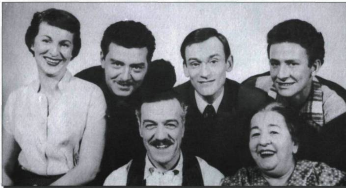
La Famille Plouffe au grand complet.