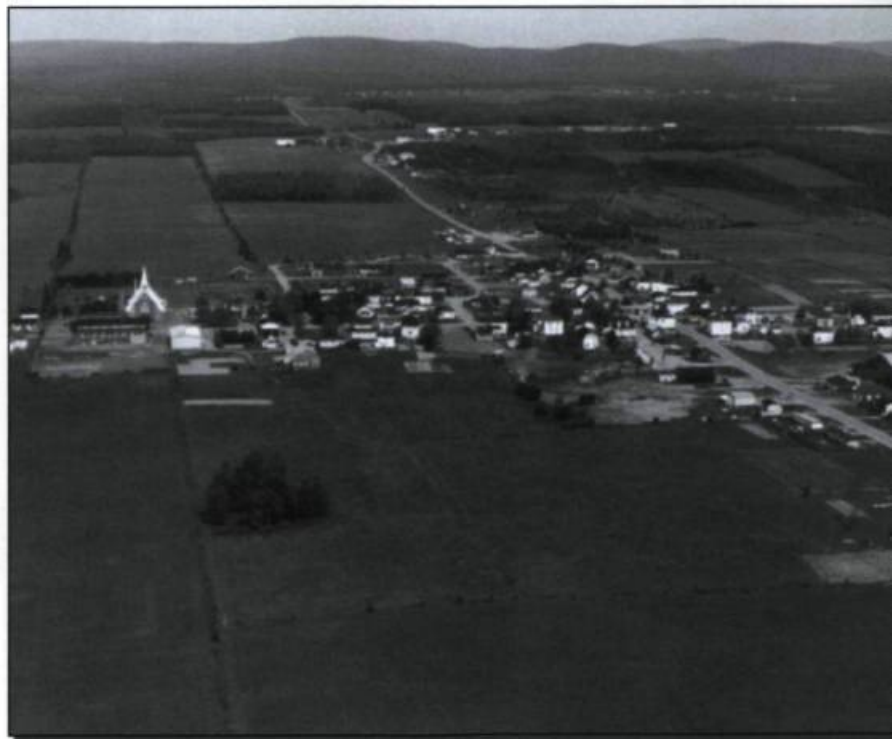
■ Vue aérienne du village de Saint-Alexis-de-Matapédia au Québec. (Archives de l'auteur).

La mémoire de l'empereur a été ravivée en Acadie contemporaine. Depuis 1998, un splendide buste de Napoléon III, qui ornait le Tribunal de commerce de Paris sous l'Empire, trône désormais en majesté dans une salle du Monument-Lefebvre à Memramcook, au Nouveau-Brunswick, berceau de la renaissance acadienne.