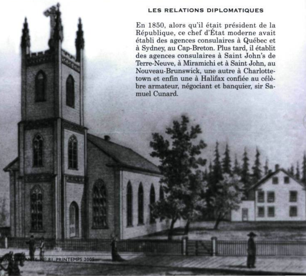
Gravure de l'église Saint-Augustin de Rustico. ( Illustrated Historical Atlas of the Province of Prince Edouard Island , 1880, p. 89).

En 1850, alors qu'il était président de la République, ce chef d'État moderne avait établi des agences consulaires à Québec et à Sydney, au Cap-Breton. Plus tard, il établit des agences consulaires à Saint John's de Terre-Neuve, à Miramichi et à Saint John, au Nouveau-Brunswick, une autre à Charlottetown et enfin une à Halifax confiée au célèbre armateur, négociant et banquier, sir Samuel Cunard.