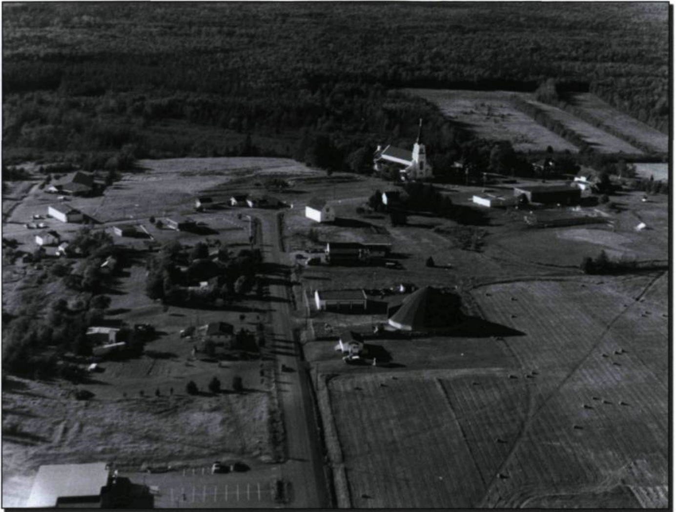
■ Vue aérienne du centre du village de Saint- Paul-de-Kent au Nouveau-Brunswick.

■ Un autre, provenant de Vichy, offert par les Amis du Musée de la Banque des fermiers de Rustico, des Amis de Napoléon III avec la participation de la Fondation Napoléon et du consulat de France à Moncton et à Halifax, a été inauguré, le 3 avril 2004, dans une salle de la Banque des fermiers de Rustico. Il s'agissait de commémorer le quadricentenaire de l'Acadie par un geste reconnaissant la pérennité de l'amitié franco-acadienne et la générosité dont Napoléon III avait fait preuve à l'égard de l'Acadie. Fort heureusement, le buste fut inauguré en présence d'un détachement de l'équipage du porte-hélicoptères Jeanne-d'Arc de la marine française et ce ne fut que justice.