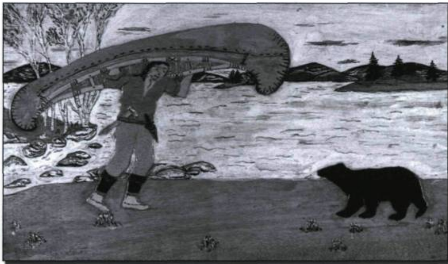
Œuvres vives aux histoires de chasses; aux histoires d'original, d'ours, de loups, de canards et d'outardes; aux histoires de portages, de pêches et de trappages... (Huile sur panneau de merisier; œuvre de l'artiste naïf Léo Carpentier, voir : Léo Carpentier, guide et peintre naïf, n° 73, printemps 2003). Collection de l'auteur.

C' est le regard qui, le premier, est naïf. Un regard primitif, ignorant des règles de l'art du regard; un regard sans formation académique, sans point de vue technique, sans code ni balise; un regard sans direction assistée, sans rectitude politique obligée, sans réticence, sans retenue, sans pudeur... sans fausse pudeur.