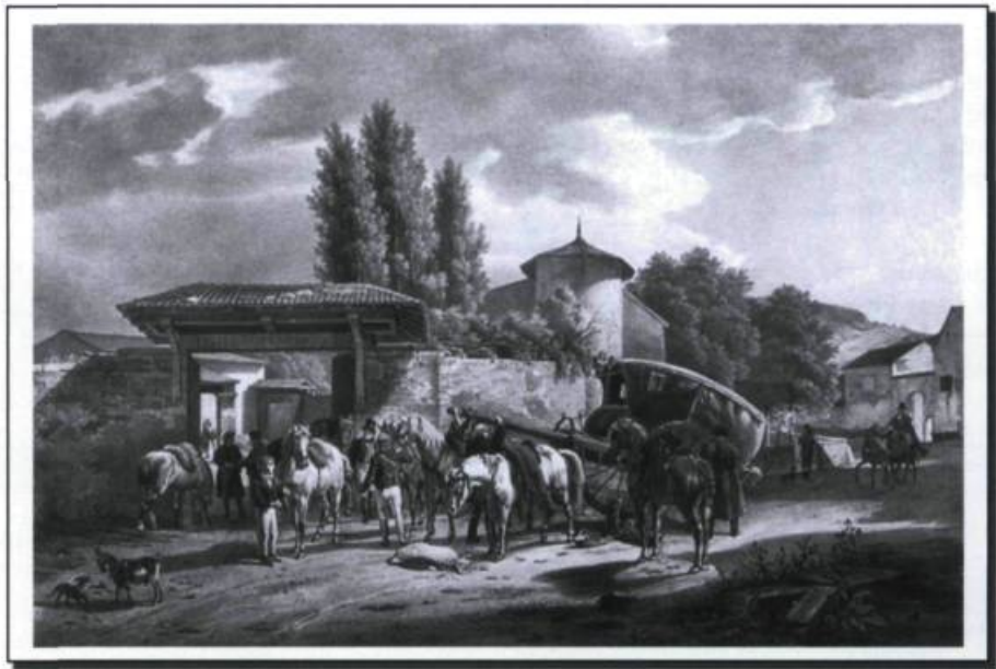
«La malle au relais», lithographie d'après une huile sur toile de Jean-Antoine Duclaux, vers 1818. (Collection du Musée de La Poste, Paris).

Exploitée à partir de 1630 par une vingtaine de maîtres des courriers, officiers chargés d'organiser le réseau d'acheminement et de distribution des lettres dans tout le royaume, la poste aux lettres est gérée, à partir de 1672, par une ferme générale des postes. Les fermiers perçoivent le revenu des lettres contre le paiement d'un bail annuel au roi. La ferme jouit du privilège exclusif de transporter les lettres jusqu'au poids de deux livres. Aussi, les messageries royales sont-elles obligées de céder leurs droits à la ferme générale des postes. Les messageries universitaires subiront le même sort, en 1719. Les messageries verront leur activité réduite au transport