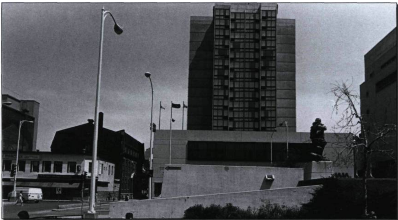
Construite en 1974, à l'entrée du nouveau Mail Saint-Roch, la tour de l'hôtel Holiday Inn est aussi une initiative visant à revitaliser le centre-ville.

Le gouvernement du Québec ne limite pas sa vision de Québec à une capitale administrative. Il y voit aussi un lieu de mémoire important où doit être mis en valeur le passé français identitaire de la nation québécoise. Le gouvernement se permet donc d'intervenir dans la sauvegarde du Vieux-Québec, le constituant en arrondissement historique, en 1963. Déjà, dans les années 1950, la Commission des monuments historiques, un organisme provincial, avait restauré les maisons Chevalier et Jacquet. En 1965, la Chambre de commerce crée la Société de la Place Royale pour la rénovation du quartier, impliquant les gouvernements provincial et fédéral. Mais, le gouvernement du Québec décide