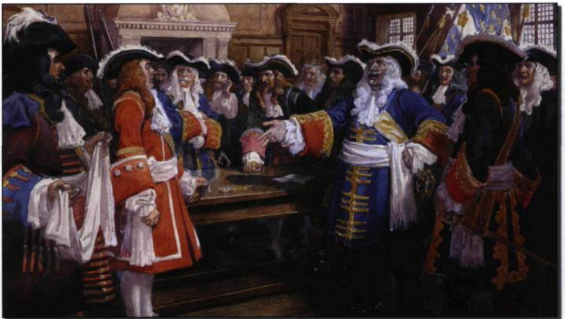
■ Frontenac recevant l'envoyé de sir William Phips venu demander la reddition de la ville, 1690. Aquarelle anonyme, vers 1925.

Québec n'est certes pas Versailles, mais l'intendant Jacques De Meulles avoue, en 1685, qu'on y vit aussi bien qu'en France. Le gouverneur Frontenac, qui a connu le faste de la cour de Louis XIV – que son épouse n'a d'ailleurs pu se résigner à abandonner –, donne en quelque sorte le ton à la bonne société québécoise. Bourg de marchands, d'artisans et de journaliers, en 1672, la capitale compte, à la fin du XVII e siècle, de plus en plus de gentilshommes gravitant autour du pouvoir, incarné par le gouverneur. Cette élite anime la vie sociale de la ville.