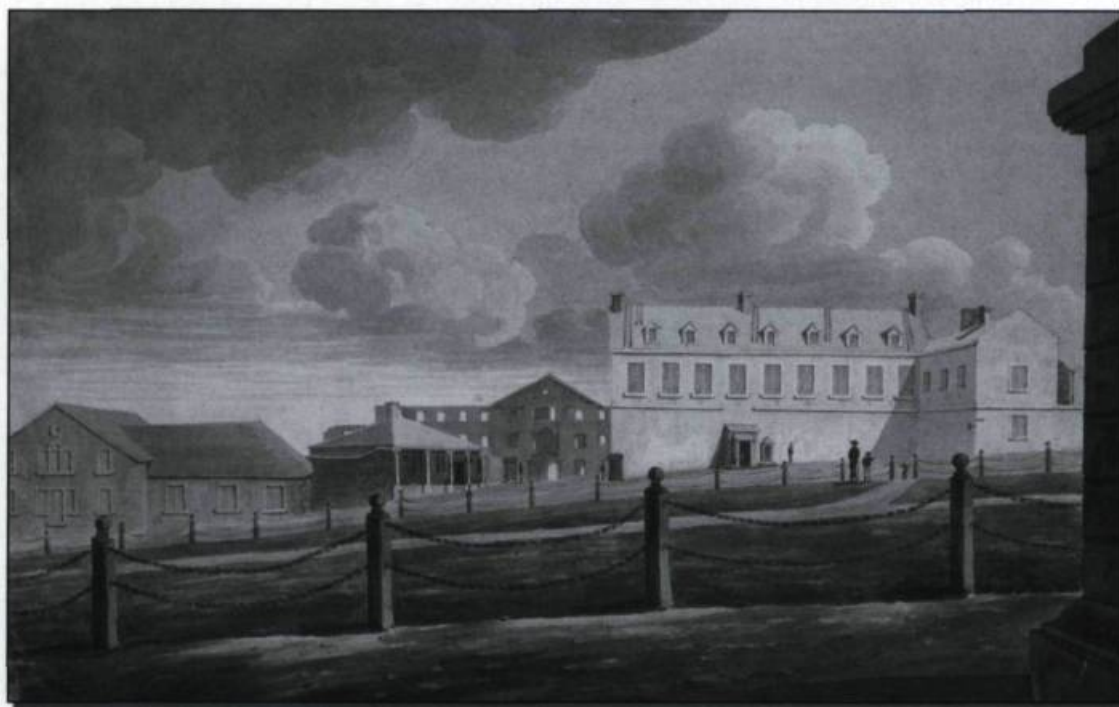
■ Vue des ruines du château Saint-Louis (à l'arrière-plan), après l'incendie de 1834. Le bastion situé à gauche du château Haldimand est un vestige de l'enceinte construite par Frontenac. Aquarelle de Charles Wright, vers 1837. (Bibliothèque et Archives Canada, C-131925).

C'est surtout son intérêt pour le théâtre que l'histoire a retenu. Si plusieurs pièces avaient été jouées dans la petite colonie, depuis la présentation, le 31 décembre 1646, du Cid de Jean Corneille dans la maison des Cent-Associés, le gouverneur Frontenac donne une nouvelle impulsion à ces spectacles montés au château Saint-Louis généralement durant le carnaval. Interrompus à la fin de son premier mandat, ces divertissements recommencent en 1689 quand il reprend du service au Canada. Outre les pièces de Corneille, on joue Jean Racine et Molière. Le théâtre, et en particulier la comédie, n'est cependant pas très apprécié par le clergé. La rumeur voulant que le Tartuffe de Molière, une satire qui s'attaque précisément aux dévots, soit interprété vaut au gouverneur de nouveaux démêlés avec l'évêque et les conseillers, en 1694. À la suite