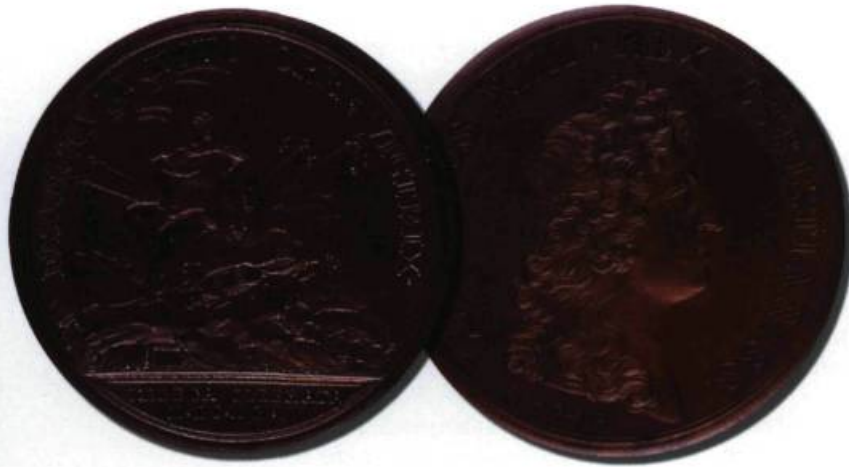
■ Médaillon Kebeca liberata frappée pour commémorer la victoire française au siège de Québec, en 1690.

d'un mandement de Jean-Baptiste de La Croix de Chevrières de Saint-Vallier, il faudra attendre le Régime anglais pour voir à nouveau du théâtre à Québec.