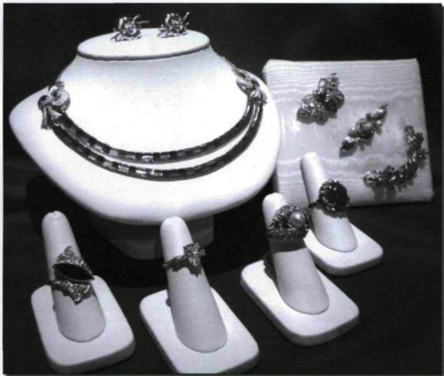
Assortiment de bijoux représentatifs des années 1940 et 1950. (Collection La Boîte à Bijoux).

Cette époque est peu propice à la fabrication de produits de luxe. On réserve le platine à l'effort de guerre, on rationne l'argent, on interdit même à certains moments le commerce de l'or. Il faut réduire l'utilisation du métal; le bijou des années 1940 sera donc léger ou parfois même formé de pièces creuses.