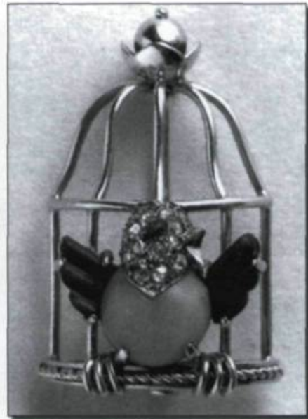
Broche Oiseau libéré , en corail, lapis-lazuli, diamants et saphir, montée sur platine (Cartier). (Archives de l'auteure).

posés de rangées successives formant des cascades. Dans la joaillerie fine, on utilise toujours les diamants et dès 1948, la plus importante société de diamants au monde, la De Beers Diamond Corporation, lance le slogan «Un diamant est éternel». Le rubis, le saphir et l'émeraude réapparaissent alors sur le marché. Le corail rose, la turquoise, le lapis-lazuli, la labradorite et l'émail ornent les colliers, les boucles d'oreilles, les fameuses bagues cocktails.