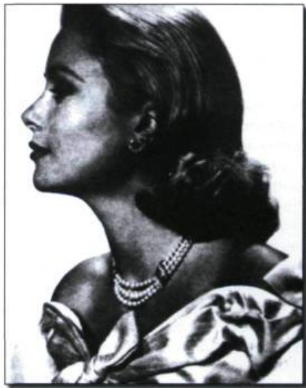
Grace Kelly parée du collier et des boucles d'oreilles en perles et diamants offerts par le prince Rainier en cadeau de mariage (Van Cleef & Arpels).

Après la Seconde Guerre mondiale, une redistribution de la richesse s'opère, on assiste alors à un mélange des classes sociales. Les hommes rentrent au pays, on célèbre de nombreux mariages; c'est le début d'un phénomène appelé baby-boom. Une ombre au tableau toutefois : dès la fin de la décennie, l'Amérique apprend que les Russes possèdent la bombe atomique... Il reste que la vie devient en général plus confortable : téléviseur, machine à laver le linge, réfrigérateur, etc.