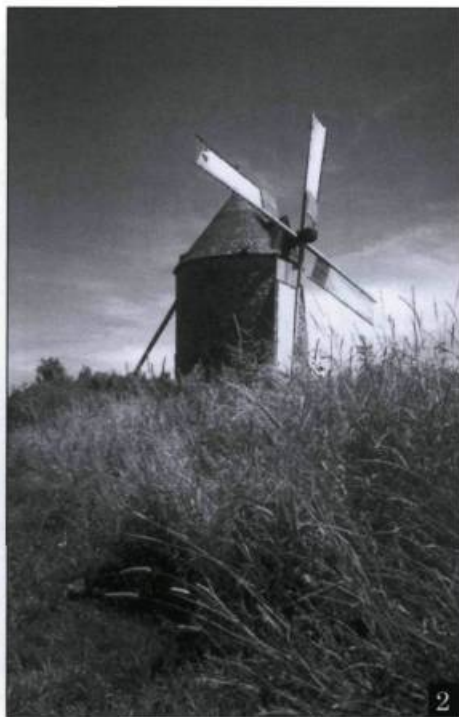
2. Moulin de l'île aux Coudres.