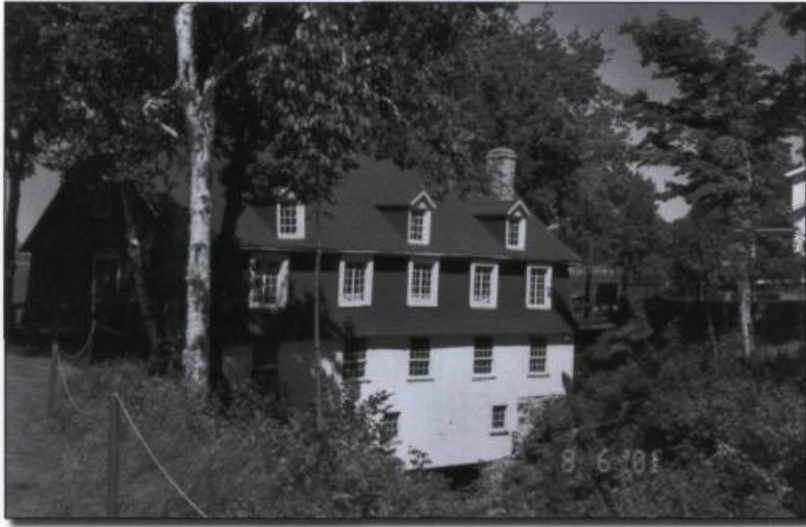
Moulin de Beaumont.

et de roues à aubes peuvent varier aussi grandement. Ce type de moulin, saisonnier, doit compter sur un débit régulier des flots. Le meunier doit donc souvent ériger une digue et une dalle afin que l'eau puisse faire tourner la roue. Sur ce point, certains seigneurs sont négligents et n'identifient pas correctement le meilleur site. Ainsi, en juin 1755, pour ne pas mettre en péril le rendement du moulin de Saint-Michel, il est «fait défense aux habitants de la Pointe-de-Lévy, de Beaumont, Saint-Michel et Saint-Vallier et à tous les autres de ne plus, à l'avenir, tuer les castors dans le ruisseau Mailloux ni dans le lac d'où ce ruisseau tire sa source, sous peine de 50 livres d'amende pour la première fois et de plus grandes peines en cas de récidive...» Voilà un cas précoce de protection de l'environnement. Les barrages construits en amont par les castors augmentaient très certainement le débit du ruisseau. La chasse, par trop intense, pratiquée par les censitaires, mettait en danger ce fragile équilibre