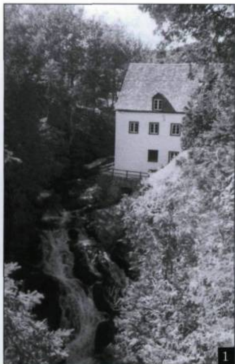
1. Moulin des Éboulements.