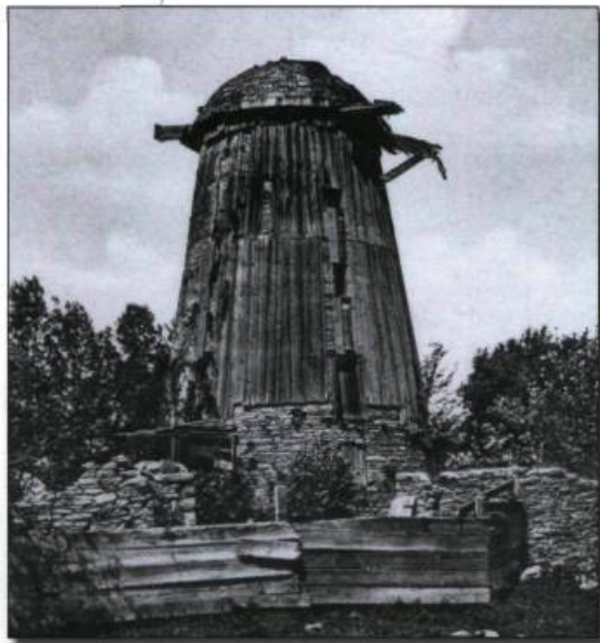
Old Windmill on the Lachine Road. Carte postale Illustrated Post Card, Montréal, vers 1908.

naturel... et son apport à l'économie seigneuriale! Le 26 février 1749, le seigneur Jean-Baptiste Boucher de Niverville reçoit le rapport de Vincent Trudeau qui déclare que «le moulin de Chambly ne peut se raccommo-der et qu'il n'y a pas assez d'eau pour le faire marcher». Voilà une situation bien nuisible à la perception des rentes.