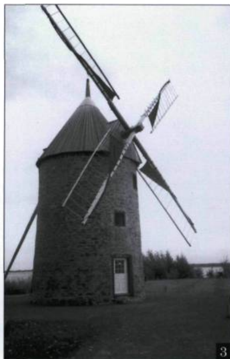
3. Moulin de l'île Perrot.