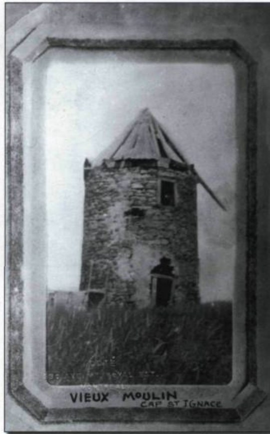
■ Vieux moulin Cap St-Ignace, Carte postale photographique Côté, Montréal. (Collection Yves Beaugard).

Le moulin à vent consiste en une tour de bois ou de maçonnerie chaulée de six à huit mètres de haut comptant deux ou, plus rarement, trois étages. Il demeure plus capricieux, car il dépend de la force du vent. En février 1760, dans la seigneurie de Lachenaie, on constate qu'une grange et une étable, récemment érigées à grands frais par le censitaire Joseph Duprat, nuisent au moulin seigneurial, coupant de manière évidente le vent. Le seigneur Jean-Baptiste-François-