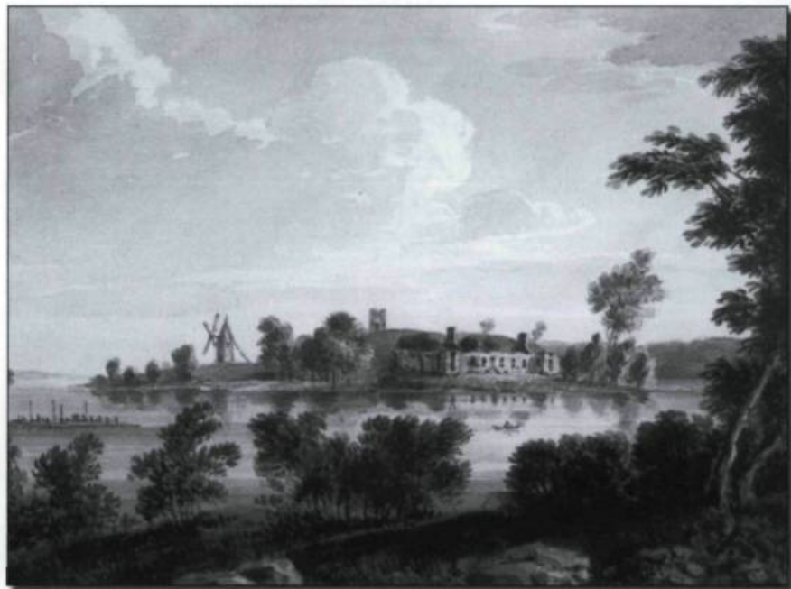
■ «Ruines du fort Senneville, paroisse Sainte-Anne, île de Montréal, 1831». Album Viger. Salle Gagnon. (Bibliothèque centrale, Ville de Montréal).

Le moulin à eau est une bâtisse de pierre de dix à quinze mètres de longueur sur sept à quinze mètres de largeur et pouvant compter jusqu'à quatre étages. Le nombre de meules