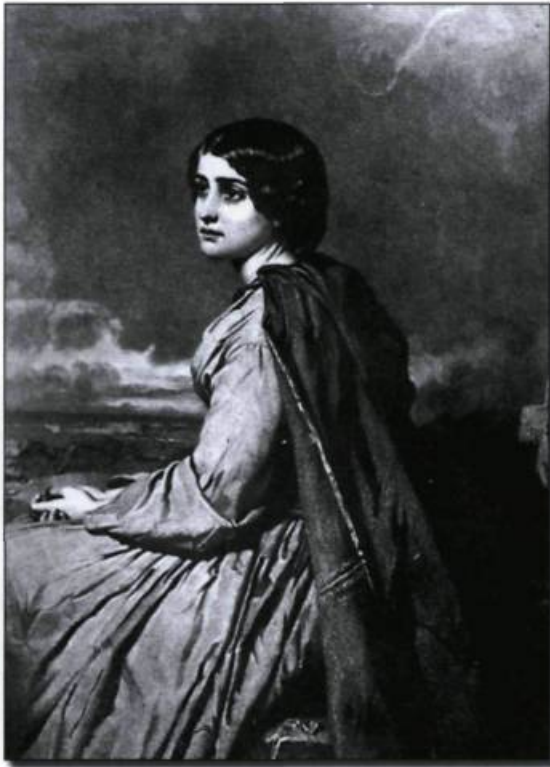
Le Grand Dérangement a inspiré plusieurs auteurs dont Henry Wadsworth Longfellow (1807-1882) auteur du célèbre poème Evangéline, en 1847. Cette huile de Thomas Faed illustre l'héroïne de Longfellow. Carte postale photographique.

Le faible nombre de la population initiale de l'Acadie (c'est-à-dire le noyau des familles fondatrices : 70 familles et 500 habitants en 1670) et l'origine commune de la majorité des colons acadiens font de la société acadienne, à la veille de la déportation, une communauté très homogène, pratiquement une grande famille étendue. On peut voir dans cette homogénéité l'origine des distinctions culturelles entre les Acadiens et les Québécois. C'est ainsi que la langue et l'accent, c'est-à-dire la manière de prononcer les mots, des Canadiens français (les Québécois) s'apparente à celle des Normands du XVII e siècle, alors que celle des Acadiens a conservé des similitudes avec celle des Poitevins de la même époque. Puisque l'Acadie est privée de l'apport de nouveaux colons dès 1710 et qu'elle est coupée de la France et du Québec à partir de la déportation, la langue des Acadiens connaît une évolution différente. C'est aussi en partie pourquoi on peut encore de nos jours distinguer l'accent acadien de l'accent québécois.