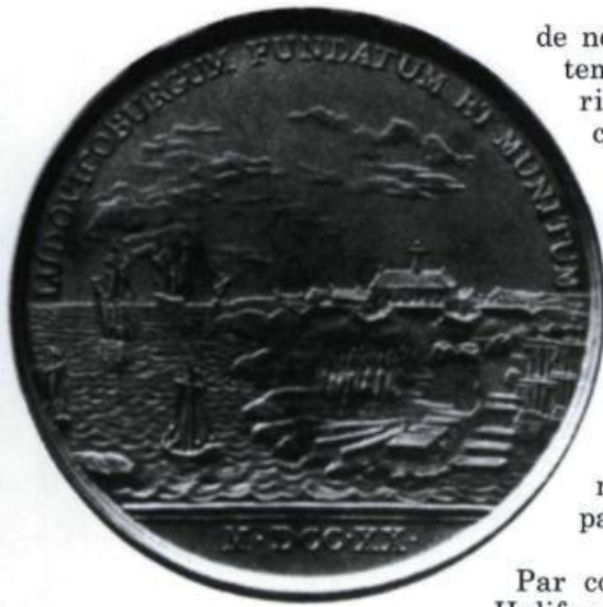
■ Médaille frappée par la France, en 1720, représentant la forteresse de Louisbourg. (Collection privée).

de neutralité est donc longtemps tolérée par les autorités anglaises qui acceptent un serment de fidélité conditionnel, ce qui ne les empêche pas de temps à autre d'essayer d'obtenir – sans succès – un serment inconditionnel de leur part. Aussi, on sait que le comportement des Acadiens sur la question du serment n'évolue pratiquement pas de 1713 à 1755.