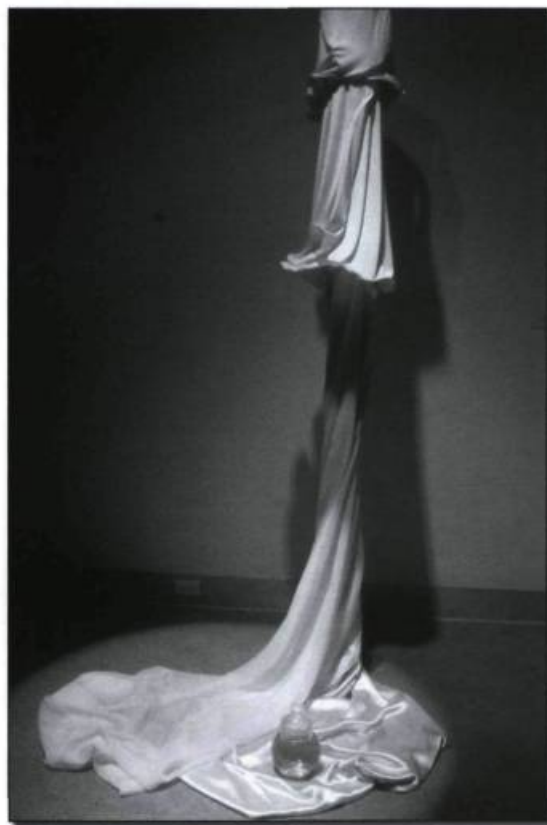
Les mémoires suspendues (2003). (Collection de l'artiste).

en matière d'achat, lui et ma mère uniront leurs connaissances. Ils transformeront le sous-sol de notre maison en petit atelier. Ma mère, qui était très habile, se chargera de la création et de la confection de divers accessoires, de chapeaux, ainsi que de vêtements de fourrure. C'est dans cet univers empreint d'une odeur particulière et de l'extrême douceur de la fourrure que j'ai grandi.