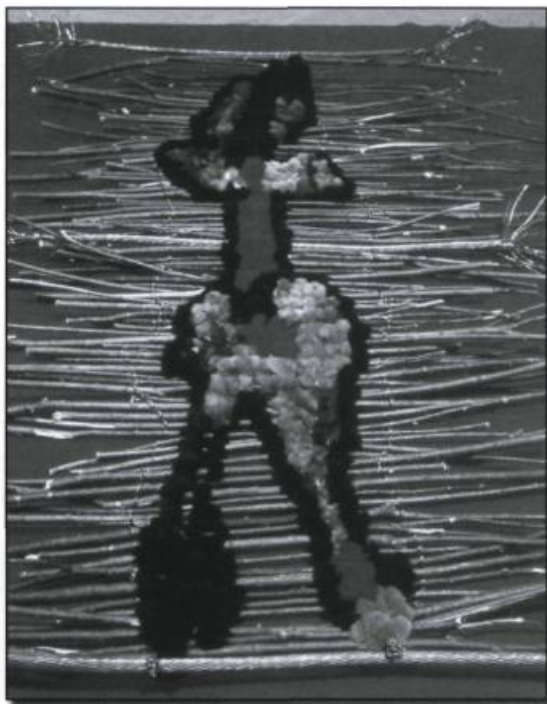
Le tapis De-s-tress (2000). Matériaux : branches, fil de cuivre, fourrure, laine. Dimensions : 1,80 m x 1,20 m. (Collection de l'artiste).

en matière d'achat, lui et ma mère uniront leurs connaissances. Ils transformeront le sous-sol de notre maison en petit atelier. Ma mère, qui était très habile, se chargera de la création et de la confection de divers accessoires, de chapeaux, ainsi que de vêtements de fourrure. C'est dans cet univers empreint d'une odeur particulière et de l'extrême douceur de la fourrure que j'ai grandi.