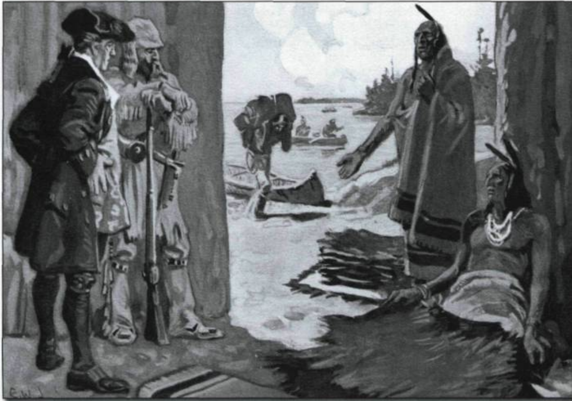
Scène de traite dans l'un des postes de la Compagnie de la Baie d'Hudson (d'après un dessin de C.W. Jefferys).