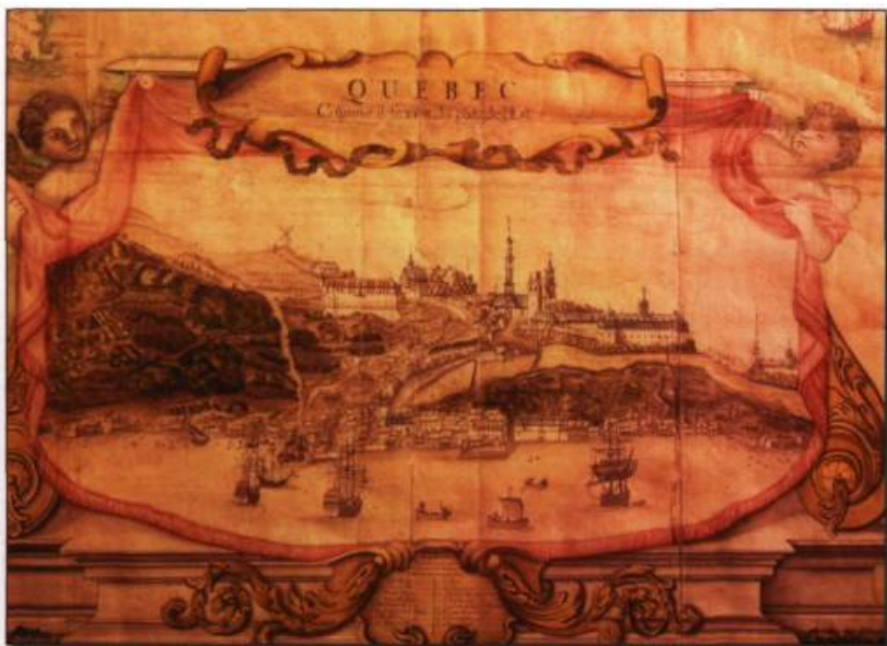
Jean-Baptiste-Louis Franquelin, cartouche de la Carte de l'Amérique Septentrionale , 1688. La ville haute est le siège des institutions civiles religieuses de la colonie, alors que les commerçants et artisans s'entassent sur l'étroite bande de terre au pied du cap.

Pierre en diagonale et les emplacements des particuliers. On dut conclure une entente pour fixer quel seigneur devrait recevoir les rentes et cens respectifs à l'avenir. C'est un exemple de contraintes imposées pas une distribution des espaces à bâtir, distribution fantaisiste et désordonnée.