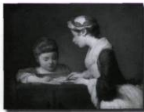
Les gens les mieux nantis pouvaient se payer un précepteur ou une gouvernante pour assurer l'enseignement à leurs enfants. Une gouvernante et son élève, peinture de Jean-Siméon Chardin, 1739. (Archives de l'auteur).

Dans une recherche de sanctification, des catholiques des deux sexes décidaient de vivre en communauté et de se consacrer à leurs semblables. Certaines congrégations jouèrent un rôle considérable dans l'enseignement. C'était à elles que l'Église préférait voir confier l'éducation des enfants.