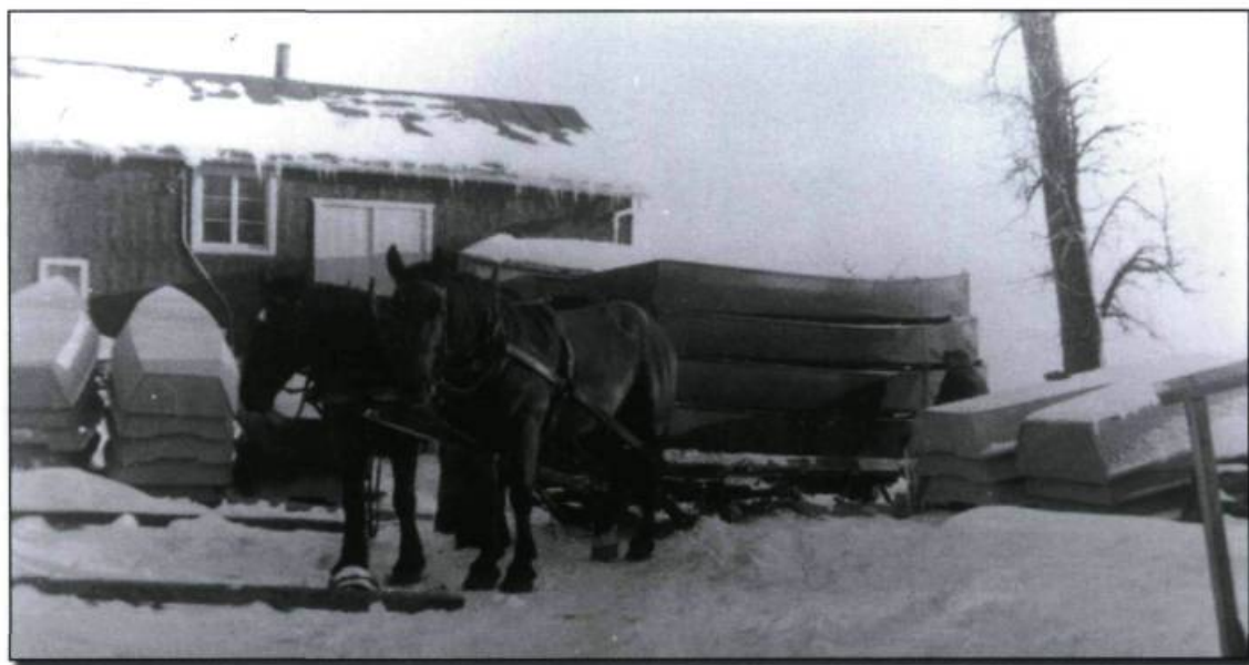
Transport de chaloupes dans les années 1940. (Collection Jean-Pierre Guyon).

La petite histoire veut que le premier fabricant de chaloupes verchères ait été... un citoyen de Saint-Sulpice! En effet, selon la version officialisée par la Société canadienne des postes, en 1991, Louis Saint-Pierre (1835-1905), habitant de l'île Bouchard – située en face de Verchères, mais rattachée à la muni-