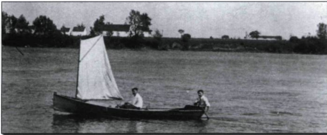
Promenade sur le fleuve, 1925. (Collection Jeanne Larose).

cipalité de Saint-Sulpice – aurait été le premier fabricant de ce type particulier d'embarcation; cela se serait passé vers les années 1850. Si tel a été le cas, il n'y en a guère de preuves dans les documents officiels anciens.