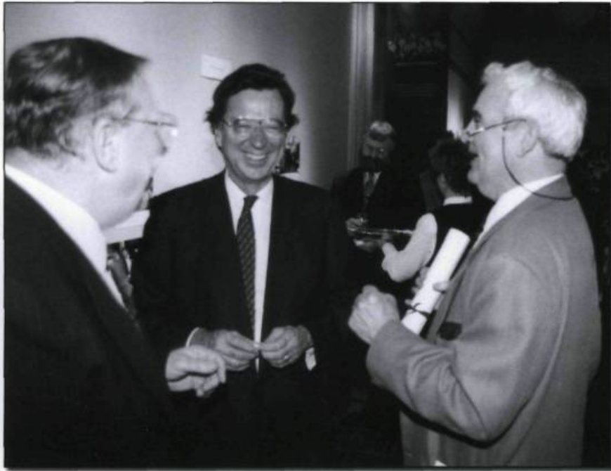
Novembre 1993, au Musée de la civilisation, à Québec : Gilles Lesage, Roland Arpin (à gauche) et Robert Bourassa. L'Assemblée nationale avait décidé de souligner les 25 années de service de huit journalistes de la Tribune parlementaire.

que des souliers et des imperméables! Et ensuite, on s'en allait à Chibougamau, où c'était encore plus froid!