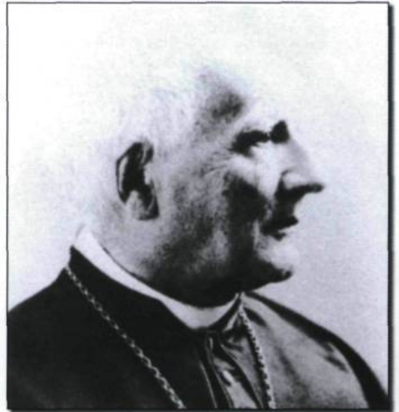
M re Louis-François Laflèche (1818-1898). Évêque de Trois-Rivières depuis 1870, il fut un adversaire acharné de Wilfrid Laurier.