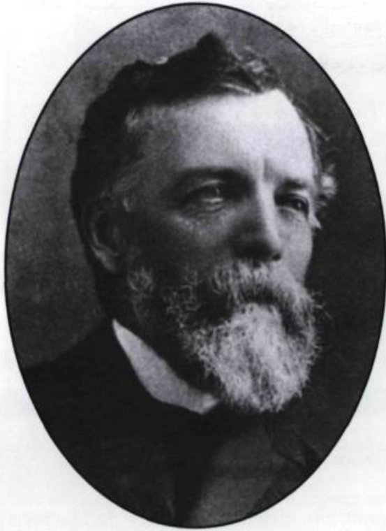
Joseph-Israël Tarte (1848-1907). D'abord député conservateur, il se rallia à Laurier qui le nomma ministre des Travaux publics (1896-1902). ( Mémorial du Québec , tome IV, p. 116).

grande, enflammée par des débats acrimonieux, les libéraux de Laurier, eux-mêmes divisés sur le sujet, ont fait échouer le projet. Ils se sont accrochés à la conciliation avec Greenway, plus rentable, selon eux, à long terme. Tous en conviennent donc ce 23 avril 1896 : seules des élections générales peuvent résoudre la question des écoles du Manitoba, et ce, d'autant plus que le septième Parlement est pratiquement parvenu au terme de ses cinq années d'existence légale. Évidemment, ce ne sera pas le seul enjeu de l'élection : il y en aura d'autres comme l'économie et les tarifs. Mais au Québec, indéniablement, voilà l'enjeu principal.