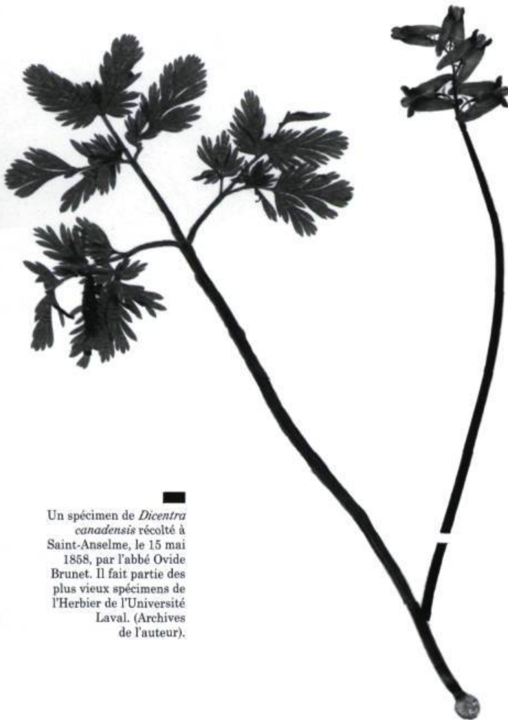
Un spécimen de Dicentra canadensis récolté à Saint-Anselme, le 15 mai 1858, par l'abbé Ovide Brunet. Il fait partie des plus vieux spécimens de l'Herbier de l'Université Laval. (Archives de l'auteur).

Robert Gauthier. «Les herbiers au Québec». Le Naturaliste canadien , vol. 122, 1998, p.26-31.