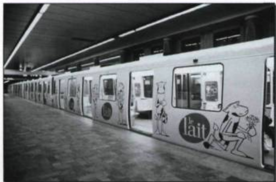
Affichage «Rame de métro».

Les moyens de communication utilisés pour promouvoir le lait nous ont fait passer du rire aux larmes, de l'étonnement au ravissement, du réel à la découverte. Nous voulons continuer à séduire tous les buveurs et buveuses de lait. Cela n'est pas fini, nous