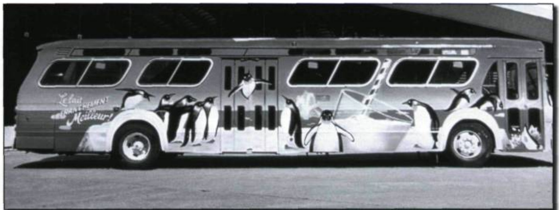
Autobus «Pingouins». (Archives de la Fédération des producteurs de lait du Québec).

Ce troisième volet de notre stratégie a été divisé en deux : la tactique rationnelle et la tactique émotionnelle. La première présentait le lait comme une source importante de calcium et une arme de première force dans la lutte contre l'ostéoporose, alors que la