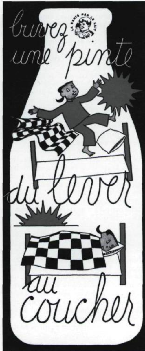
Carton dessiné par Julien Hébert. (Fonds Julien-Hébert, Musée du Québec).

La fondation est établie à Montréal et œuvre principalement sur ce marché. Cependant, les campagnes publicitaires dans les grands quotidiens, à la radio ou la télévision, profitent à l'ensemble de l'industrie laitière de la province. Comme le travail de terrain constitue un volet important de l'action éducative de l'organisme, l'Association des distributeurs, qui devient l'Association des industriels laitiers, en 1954, incite fortement ses membres, des différents marchés de la province,