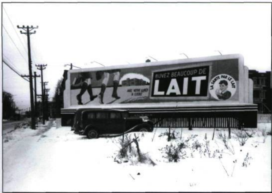
Panneau publicitaire de La Santé par le Lait, vers la fin des années 1950. (Fonds Hayward Studio, Archives nationales du Canada, PA-81581).

L'objectif étant de modifier de façon permanente les habitudes alimentaires de la population, les jeunes constituent la première cible de la fondation. Année après année, le tiers du budget de l'organisme est consacré aux interventions menées auprès des jeunes. La fondation distribue dans les écoles de la ville, du matériel et de la documentation, qui illustrent de façon colorée et souvent humoristique les qualités nutritives du lait. Des campagnes éducatives dans les revues d'écoliers sont aussi élaborées par la fondation, alors que certains personnages connus des enfants véhiculent des messages sur l'importance de la consommation quotidienne de lait.