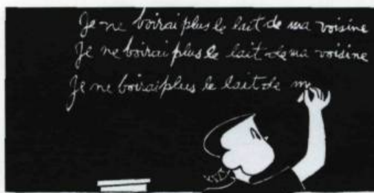
Caricature de Mouchette réalisée par Julien Hébert.