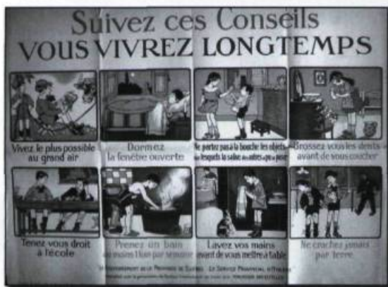
Affiche du Service provincial d'hygiène, Québec, vers 1920. (Archives privées de l'auteur).

tueuses est chose fréquente en Amérique et en Europe tout au long du XIX e siècle. Comme l'indiquent certains historiens américains, les milieux puritains de New York et certains hygiénistes parisiens soulignaient avec insistance l'étroite relation entre l'usage des plaisirs et l'augmentation des risques de maladie infectieuse.