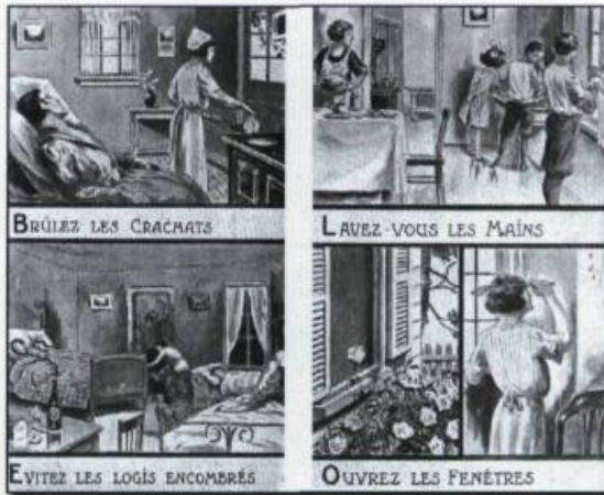
Extraits d'un calendrier diffusé par le Service provincial d'hygiène, Québec, 1924. (Bibliothèque des sciences humaines, Université de Montréal).

Mais si l'hygiène domestique doit occuper une place importante dans les habitudes de vie, elle doit être accompagnée d'une bonne hygiène morale. Aussi, dénonce-t-on certaines habitudes «vicieuses» et certaines fautes morales qui prédisposent à l'infection. Le procédé n'a rien de nouveau. La référence aux propriétés préventives des conduites ver-