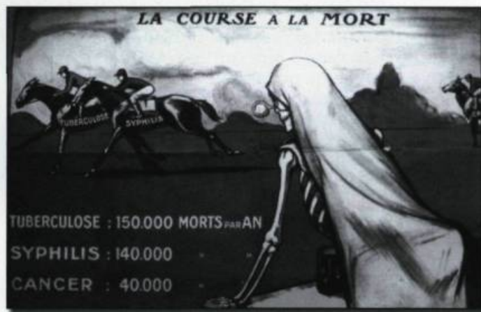
Affiche du Service provincial d'hygiène, Québec, vers 1915.

Les catégories générales et traditionnelles issues du sens commun quant aux causes «favorisantes» des maladies infectieuses (faute morale, chagrin, peur, mélancolie, intempérance, etc.) persistèrent encore longtemps et s'intensifièrent même avec l'implication accrue d'hygiénistes qui associaient science médicale, science sociale et science morale. En 1906, un médecin propose l'enfermement des alcooliques qui «par leurs scandales, leurs sollicitations, leur déséquilibre morale sèment autour d'eux la pire des contagions : celle de la ruine et du vice». Le Journal d'hygiène populaire se propose «d'hygiéniser le peuple et d'élever l'œuvre de vulgarisation de l'hygiène à la hauteur d'un grand intérêt social». Mais plus encore, il souhaite «montrer combien les préceptes de l'hygiène et de la raison s'allient pour rendre l'homme meilleur et plus heureux».