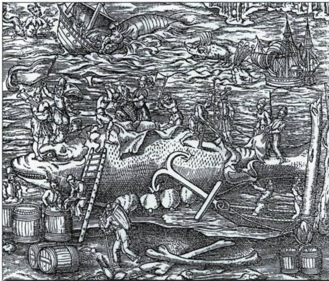
Joueur de cornemuse sur les bords du fleuve Saint-Laurent (à gauche sur le nez du poisson). André Thévet. Cosmographie universelle. Folio 1017, 1575.

C'est en prenant le contre-pied de l'histoire, en étudiant ces petits serviteurs que sont les instruments, que l'on brossera une esquisse de la musique instrumentale en Nouvelle-France et de ce qui a pu en rester dans notre musique traditionnelle.